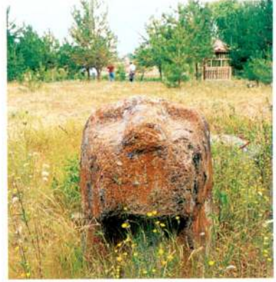
2.b - Alaca Höyük'te bulunmuş kapı arslanı taslađı (1994).