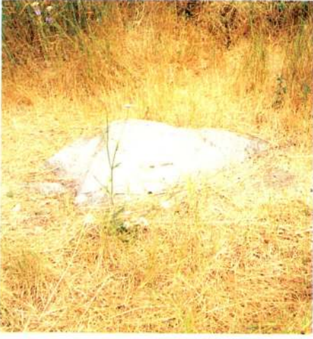
1.a - Çift başlı arslan protomunun açığa çıkartılmasından önceki durum (1993).