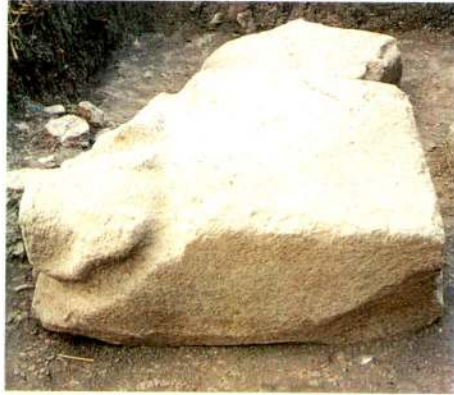
1.d - Aynı eserin güney yönden görünümü.