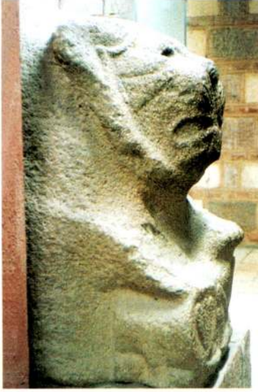
2.a - Alaca Höyük'te bulunmuş arslan tasviri (Anadolu Medeniyetleri Müzesi /Ankara).