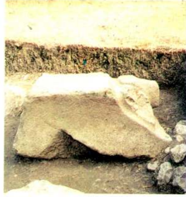
1.b - Aynı eserin günışığına çıkarıldıktan sonra kuzey yönden görünümü.