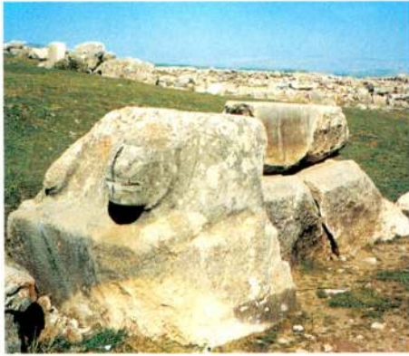
2.c - Arslanlı Tekne/Boğazköy.