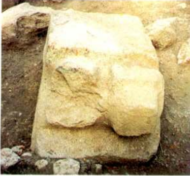
1.c - Aynı eserin Bau yönden görünümü.