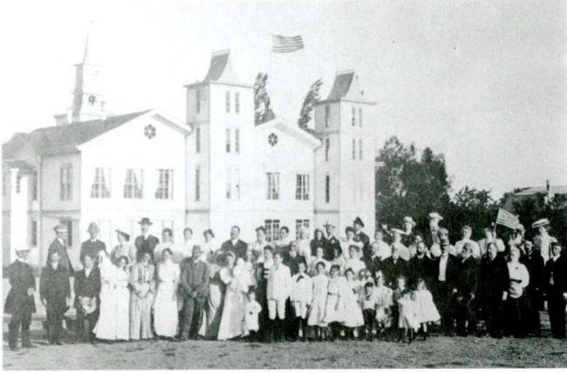
Res 5 — 1910 yılında yapılan misyonerlerin yıllık toplantısına katılanlar, Anadolu Koleji önünde toplu halde görülüyor.