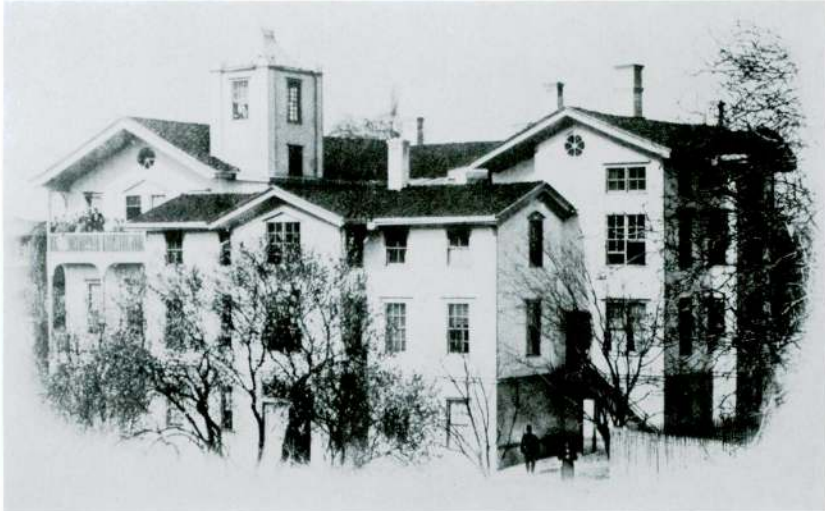
Res. 2 — Merzifon Anadolu Koleji'nde kız öğrencilerinin kaldığı binadan bir görünüm.