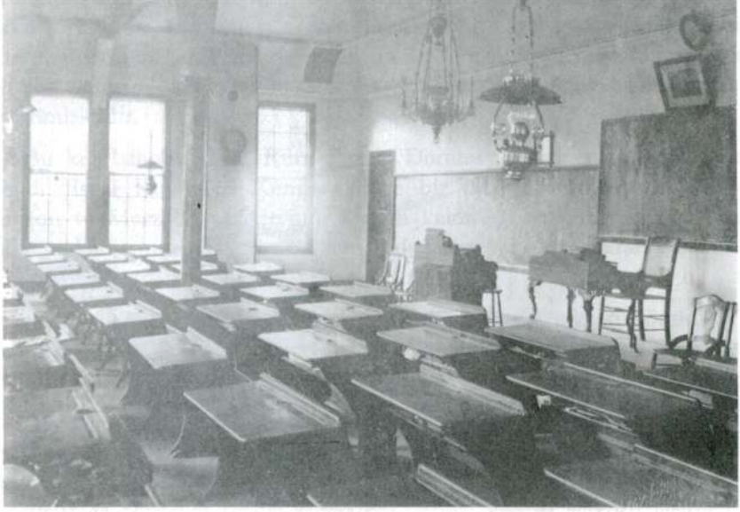
Res. 3 — Anadolu Koleji'nde bir dersaneden görünüm.