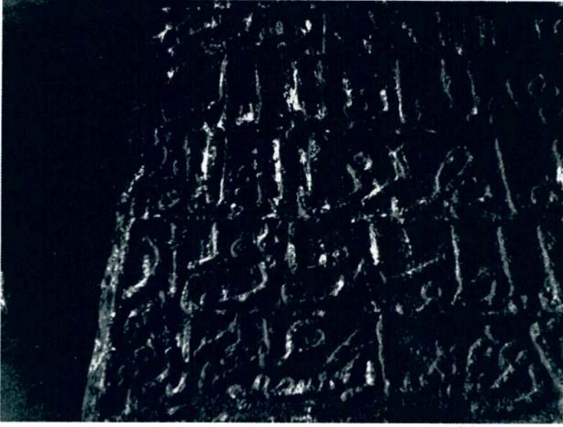
Resim 1 — Nıksar Süleyman Şah Kitabesi