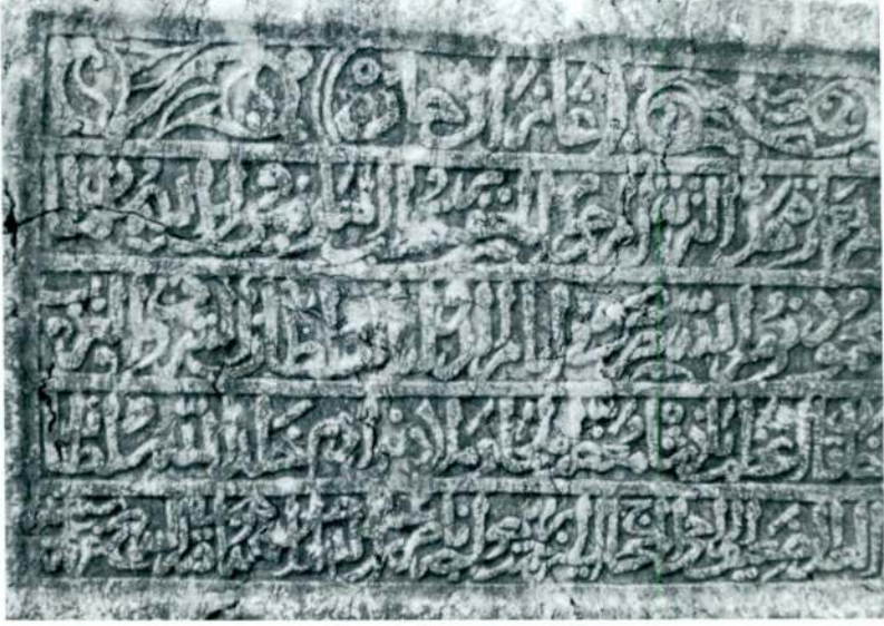
Resim 3 — Gazan Mahmud Han Kitabesi - Gümenek