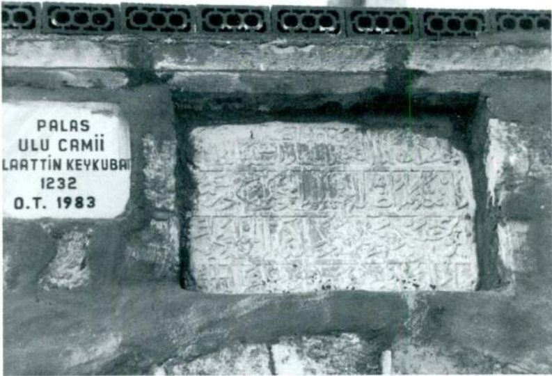
Resim 4 — Palas Köyü Kitabesi