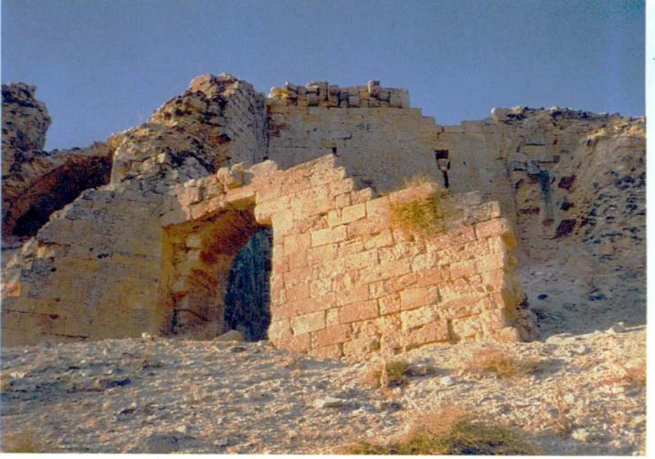
Resim 5 — Giriş kapısının başka bir görünüşü