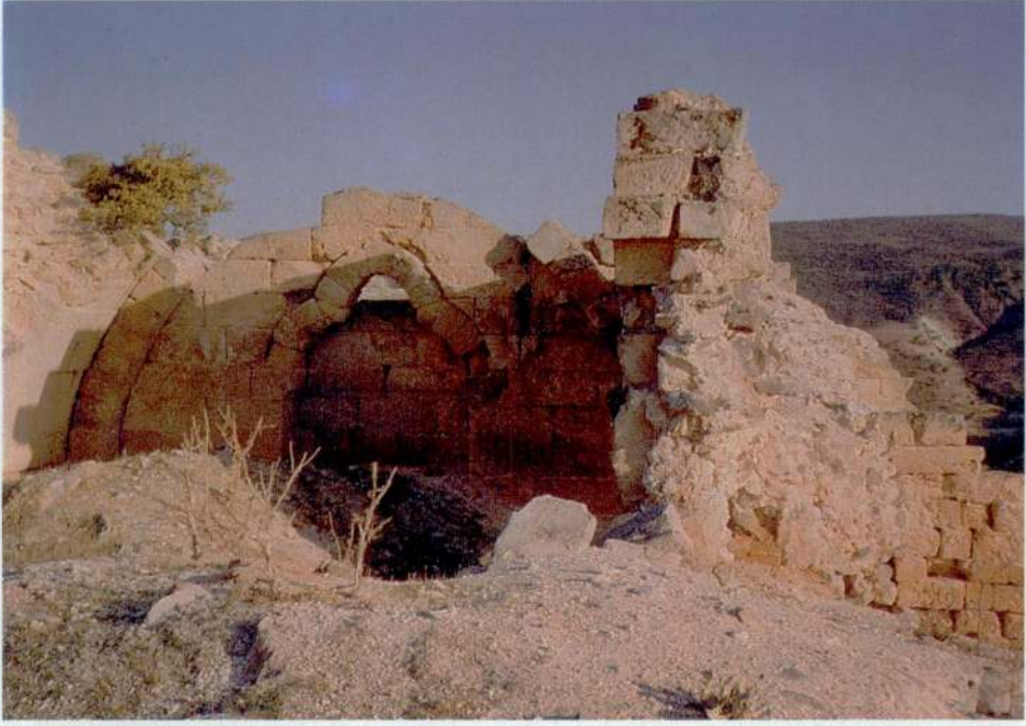
Resim 7 — Kale içinde bina kalıntısı