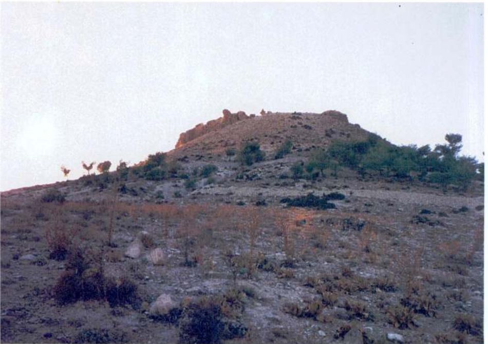
Resim 2 — Râvendân kalesinin Belenözü köyünden görünüşü