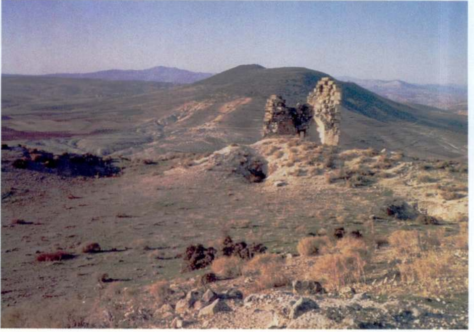
Resim 9 — Kalede bir burc kalıntısı