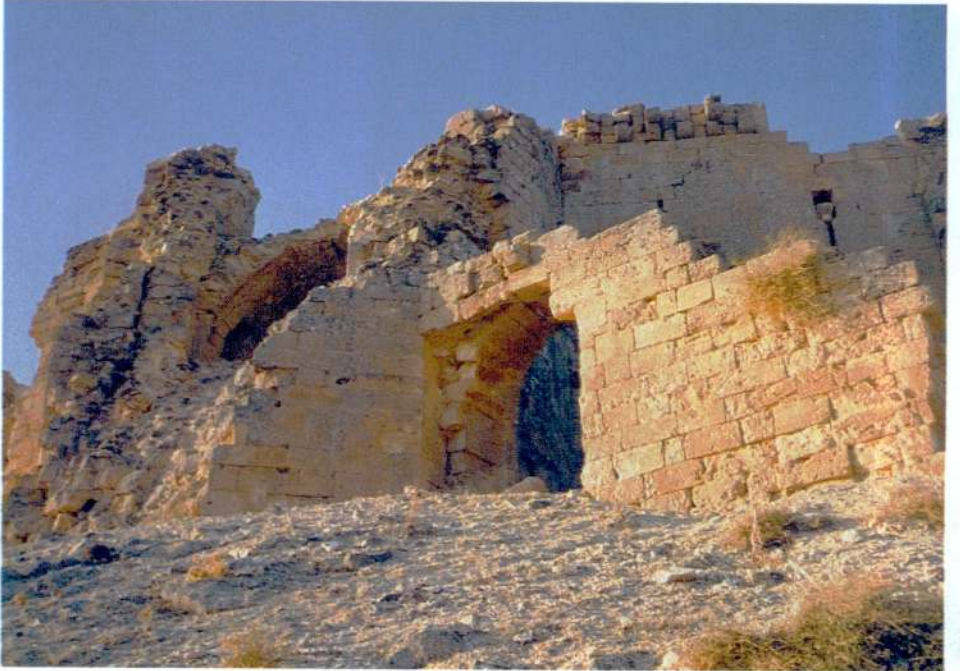
Resim 6 — Giriş kapısından görüntü