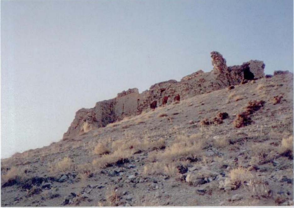
Resim 3 — Râvendân kalesine tepenin eteğinden bakış