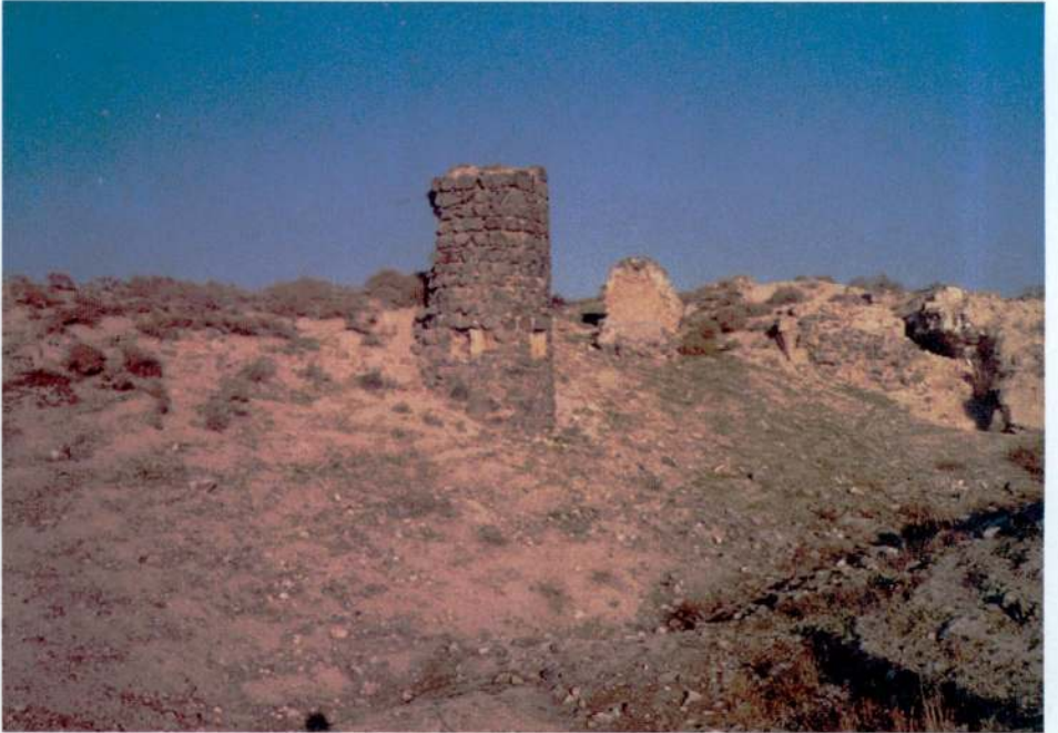
Resim 10 — Kale surlarında burc kalıntısı