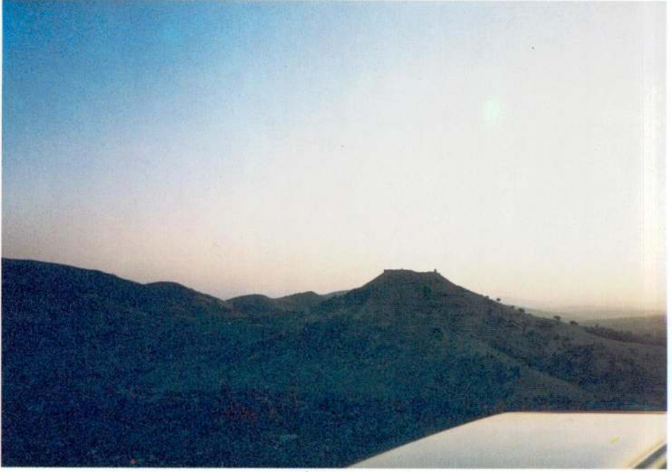
Resim 1 — Râvendân kalesinin yoldan görünüşü