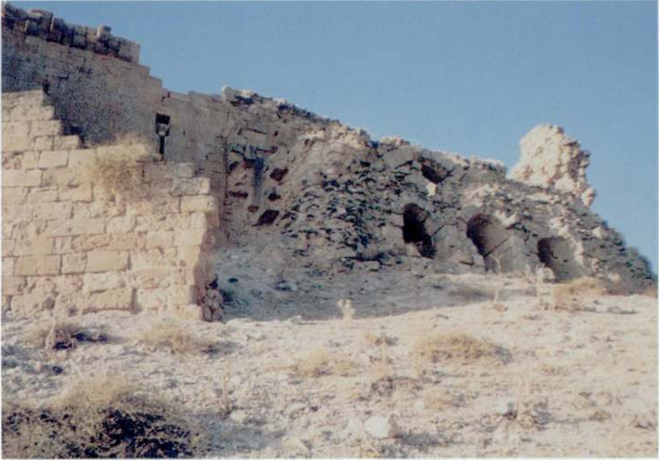
Resim 4 — Kalenin üç gözlü giriş kapısı