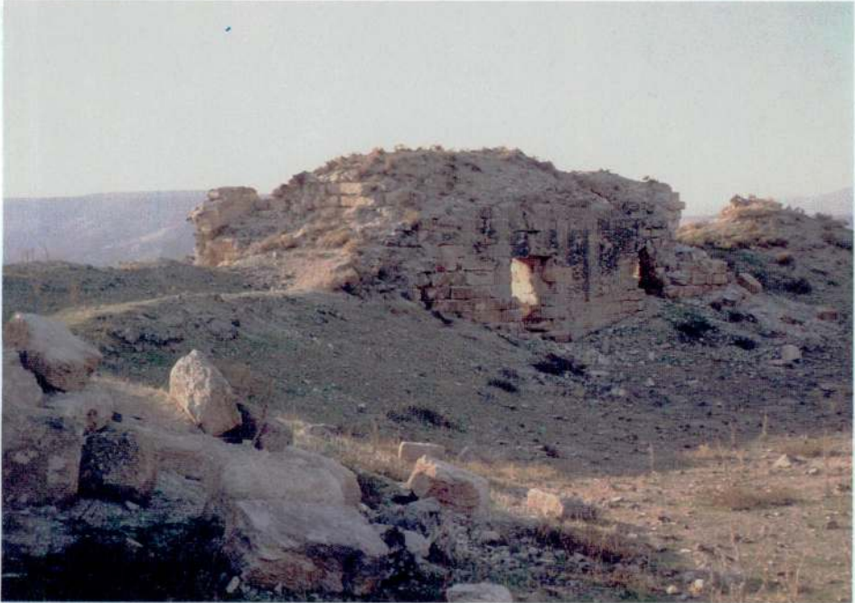
Resim 8 — Kale içinde bina kalıntısı