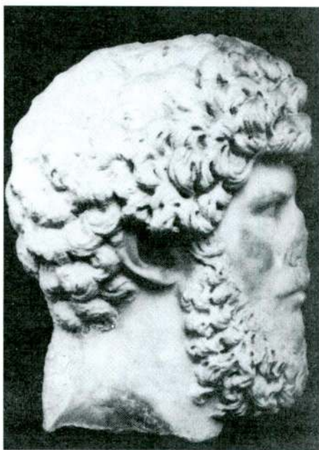
Res. 7 – Lucius Verus