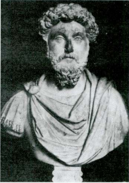
Res. 1 – İmparator Marcus Aurelius