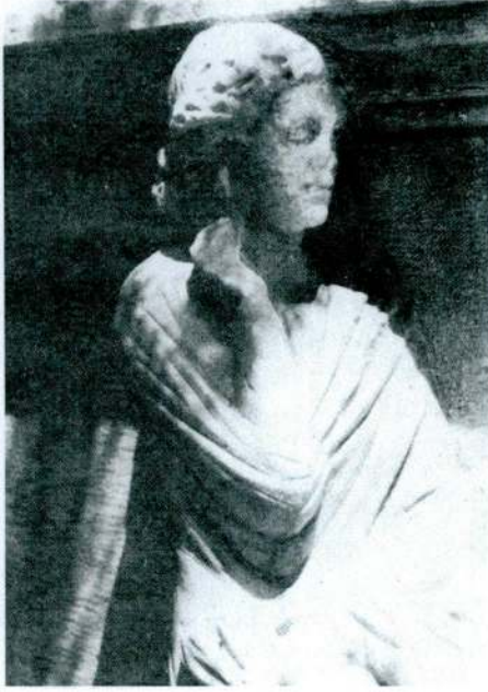
Res. 15 – Konya Müzesi'nde bulunan bir Lahitten detay