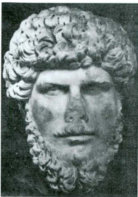
Res. 8 – Lucius Verus