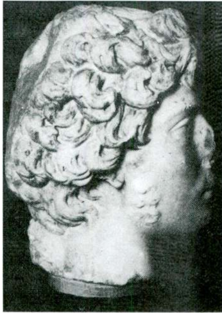
Res. 6 – Marcus Aurelius'un gençlik portresi