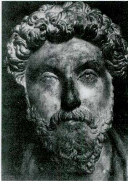
Res. 2 – İmparator Marcus Aurelius