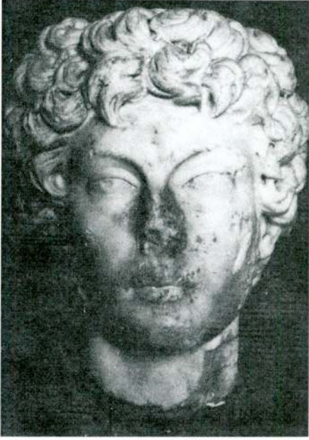
Res. 5 – Marcus Aurelius'un gençlik portresi