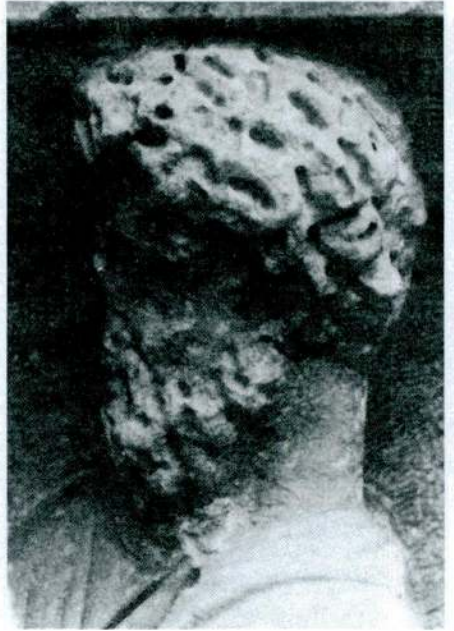
Res. 16 – Konya Müzesi'nde bulunan bir Lahitten detay