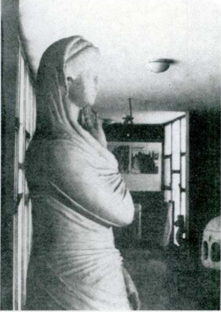
Res. 13 – Afyon Müzesi'ndeki giyimli kadın yontusu