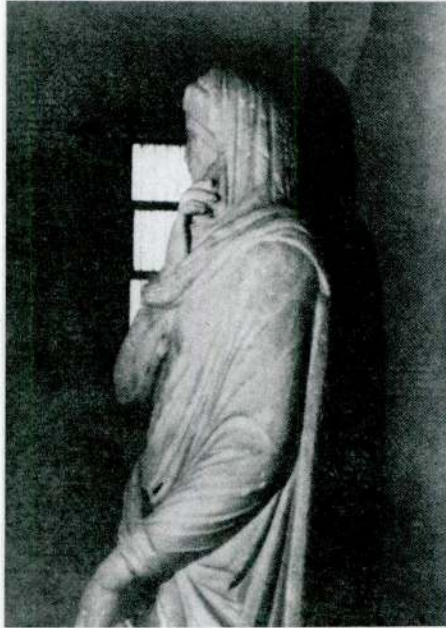
Res. 14 – Afyon Müzesi'ndeki giyimli kadın yontusu