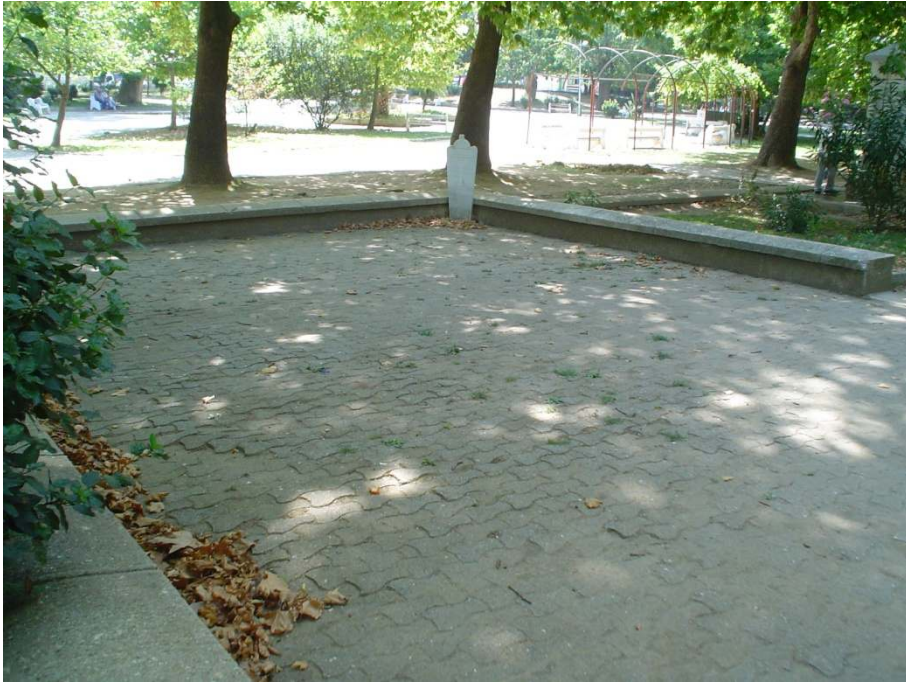
Ek 12: Namazgâh