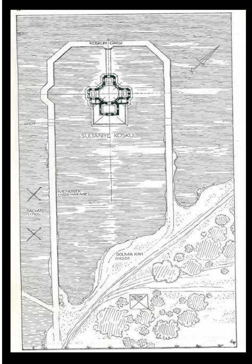
Ek 3: Hakkı Eldem'dem tarafından yapılan Acem Köşkü krokisi (Türk Bahçeleri, s. 14)