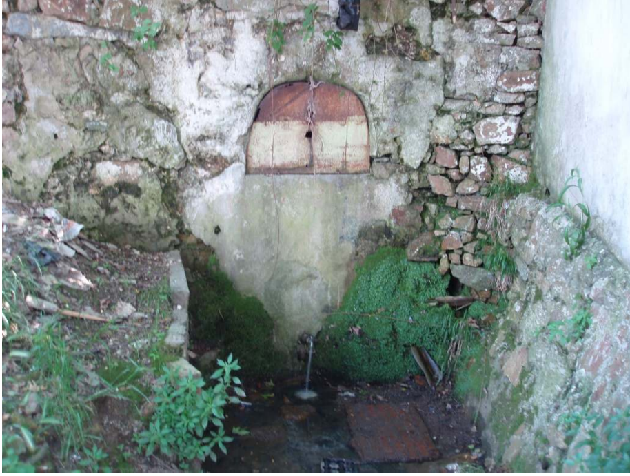
Ek 9: Ayios Eostantinos Ayazması