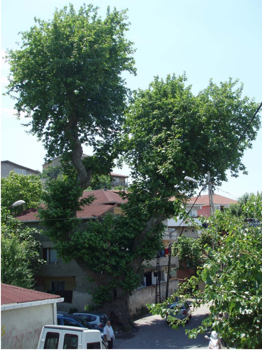
Ek 10: Ayios Eostantinos Ayazmasının yanındaki ulu ınar