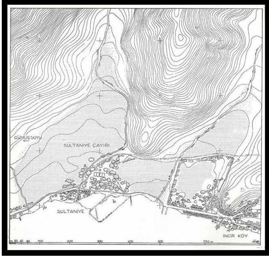
Ek 4: Hakkı Eldem'dem tarafından yapılan Sultaniye Bahçesi krokisi (Türk Bahçeleri, s. 16)