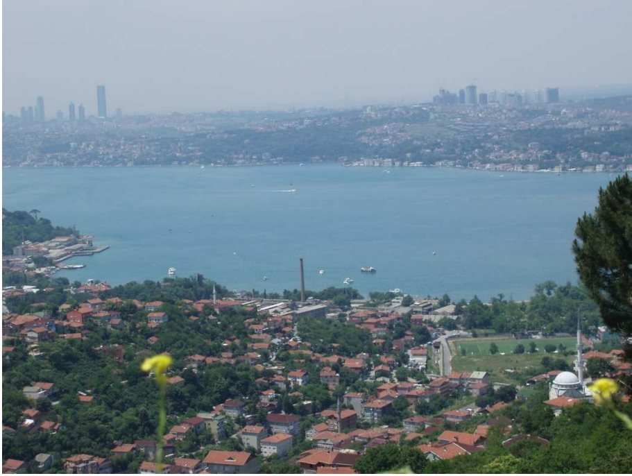
Ek 8: Günümüzde Sultaniye'nin doğudan (Karlıtepe'den) görünüşü