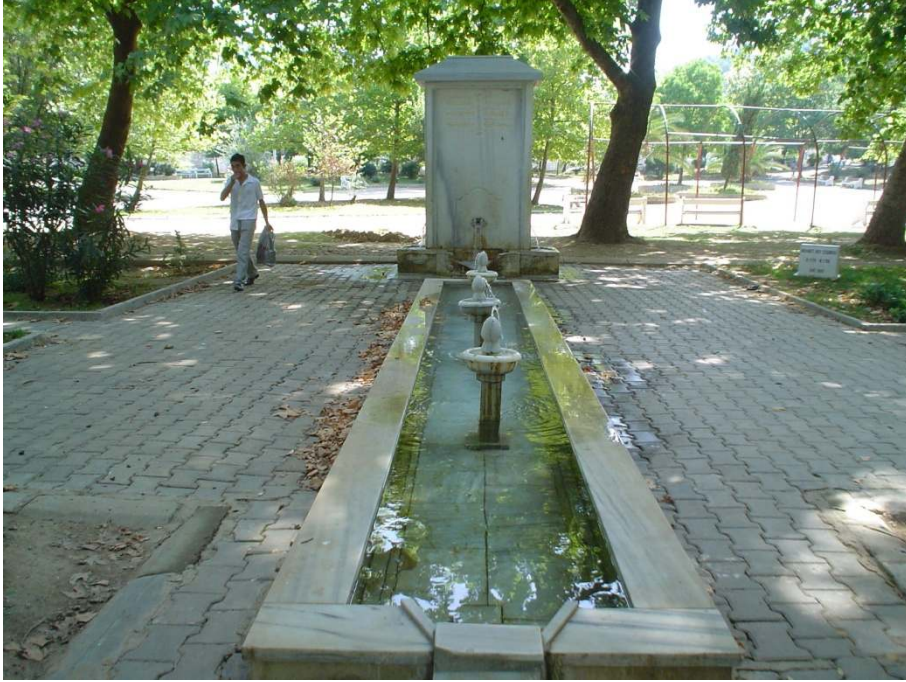
Ek 11: Mehmed Bey Çeşmesi