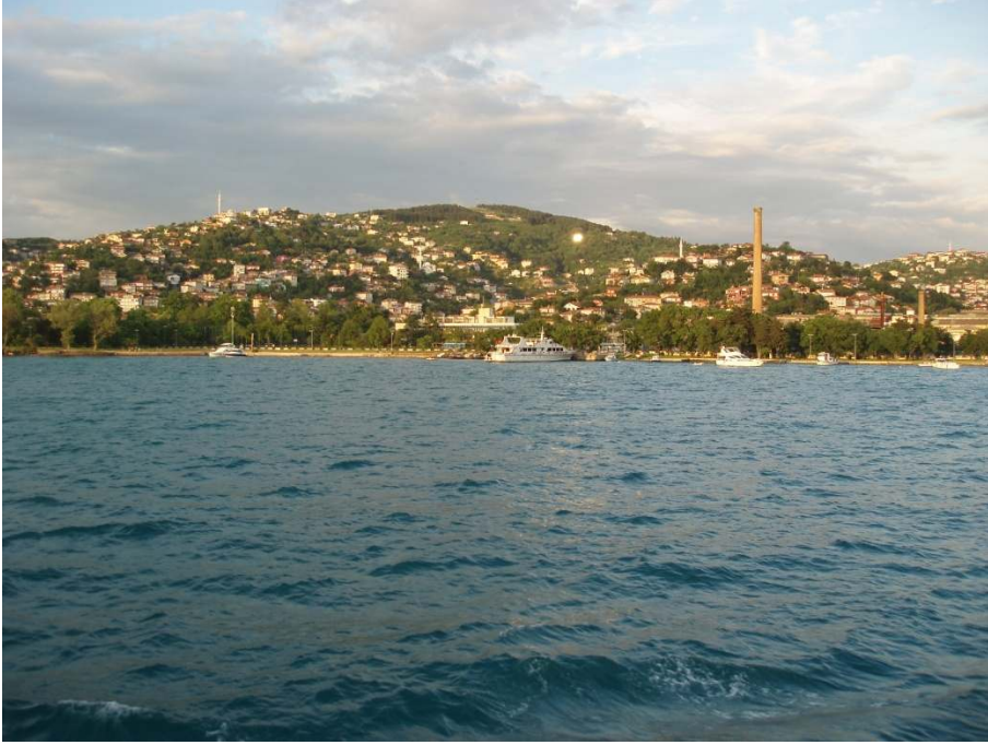
Ek 7: Günümüzde Sultaniye'nin deniz tarafından görünüşü