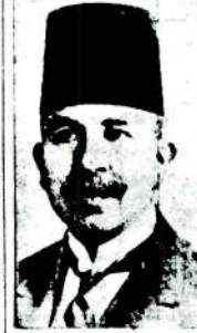
Mısır Başvekilî İsmail Sıtkı Paşa

ANKARA, 7 (Telefonla) — Ortada hiç bir şey yokken, arif bir İngiliz ajanının tevriyi yüzün den çıkarılan bir fes hikâyesi do-layisile Mısır gazetelerinin, böyle