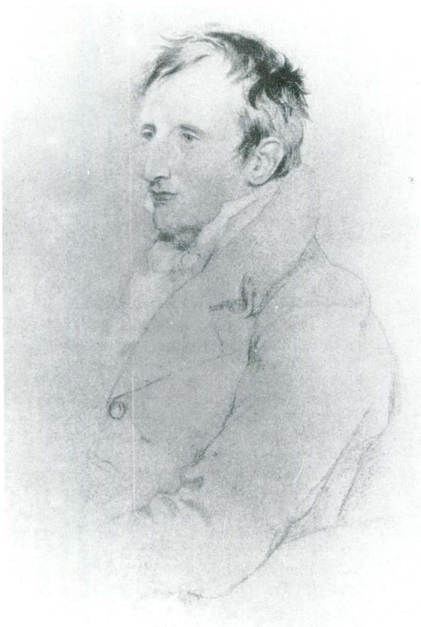
Res. 1 — Josef von Hammer - Purgstall (1774 - 1856)'in portresi.