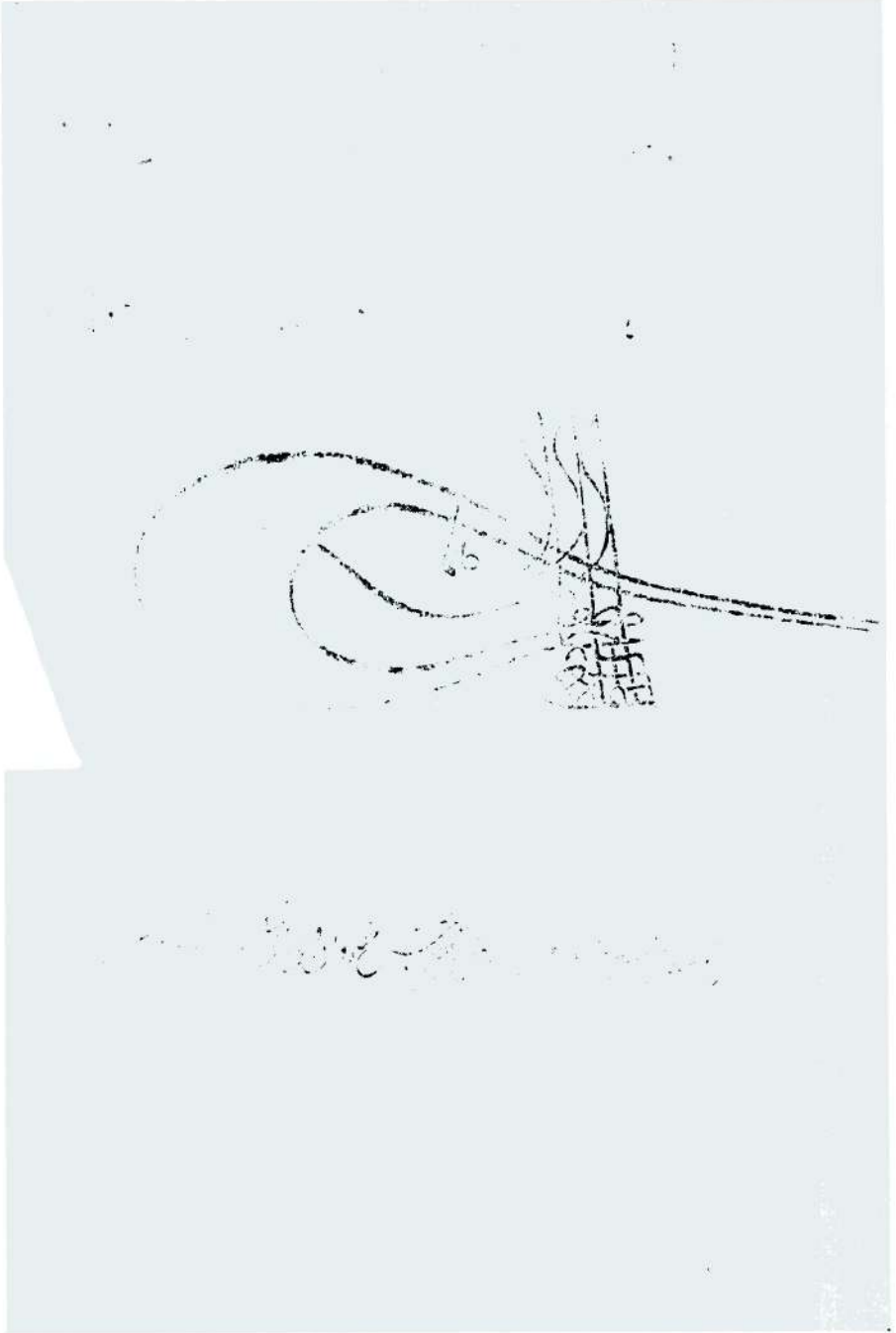
Belge 2 — Kanuni Sultan Süleyman'ın Polonya Kralı Zigmund August'a yazdığı mektup. (Cemaziyelevvel 934)