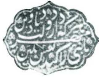
Belge 4 — Hürrem Sultan'ın mühürü.