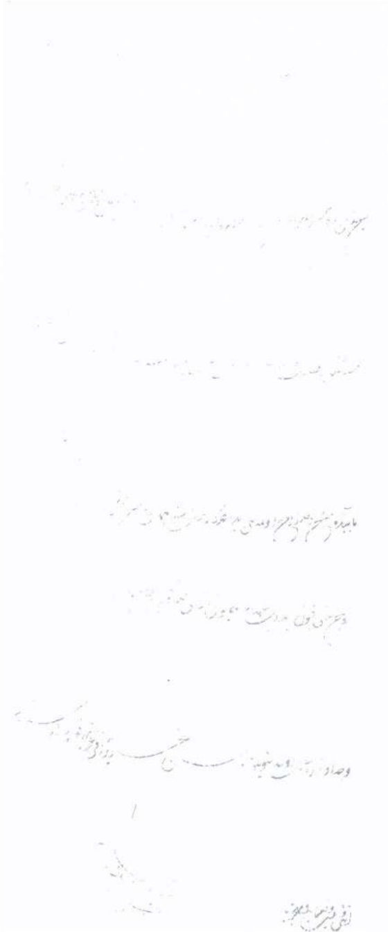
Belge 2'nin devamı.