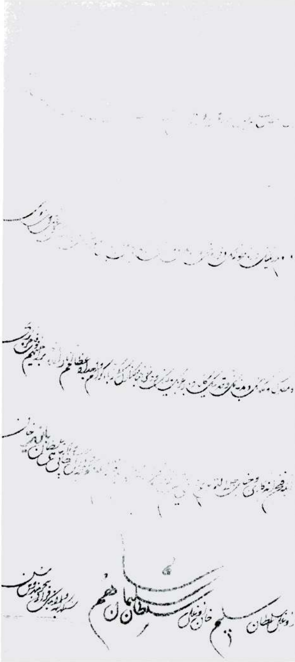
Belge 1 — Kanuni Sultan Süleyman'ın Polonya Kralı Zigmund August'a yazdığı mektup. (1 muharrem 932)