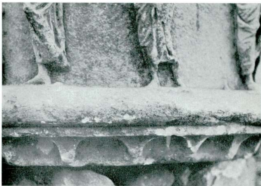
Abb. — Res. 3