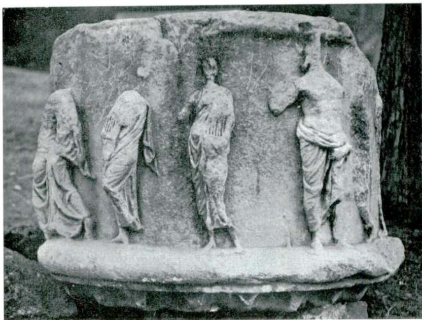
Abb. — Res. 1