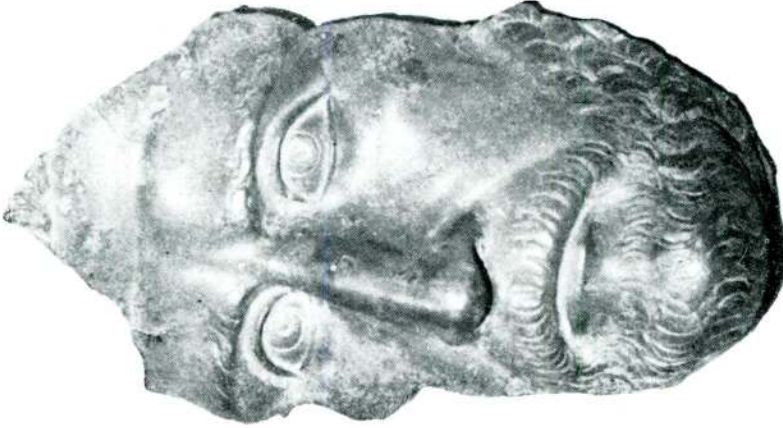
Res. 1 — Ankara Arkoloji Müzesinde bulunan portre yüzü