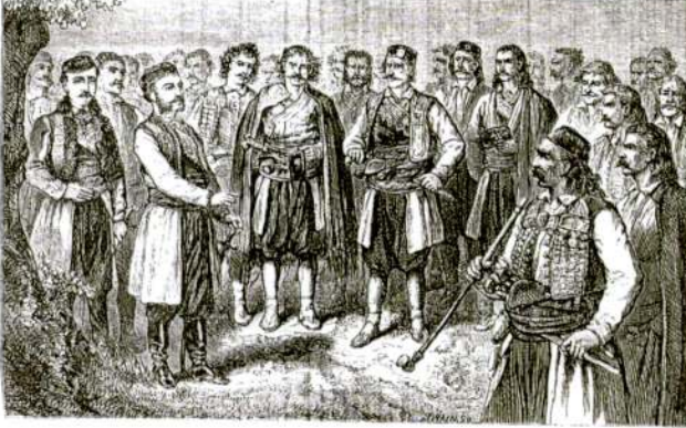
UNDER THE TREE AT CRISJE

Resim 9: Riyeka Savaşı sonrasında Vladika Nikola'nın Çetine'de Karadağlı şeflerle yaptığı toplantı.