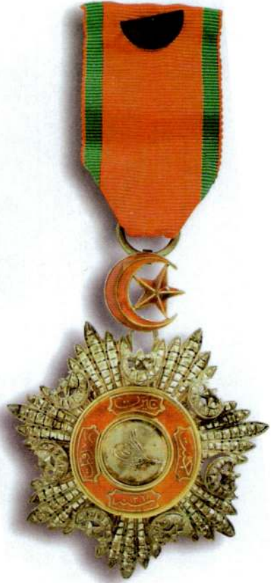
Resim 15: Beşinci Rütbe Mecidi Nişanı. Kaynak: Eldem, a.ge. , s. 194.