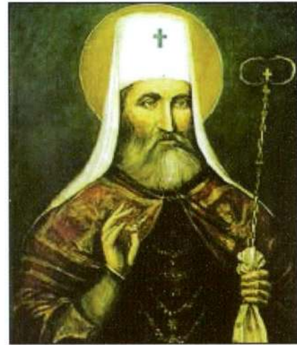
Resim 4: Petar I Petrovic Njegos (1782-1830)