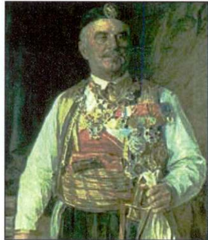
Resim 8: Nikola (1860-1918)