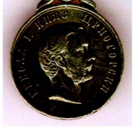
Resim 18: Karadağ tarafından bastırılan "1862 Cesaret Madalyası" ön yüz. Kaynak, Mehmed Subhî, a.g.e. , s. 80, 91, Levha: 5; http://www.medal-medaille.com .