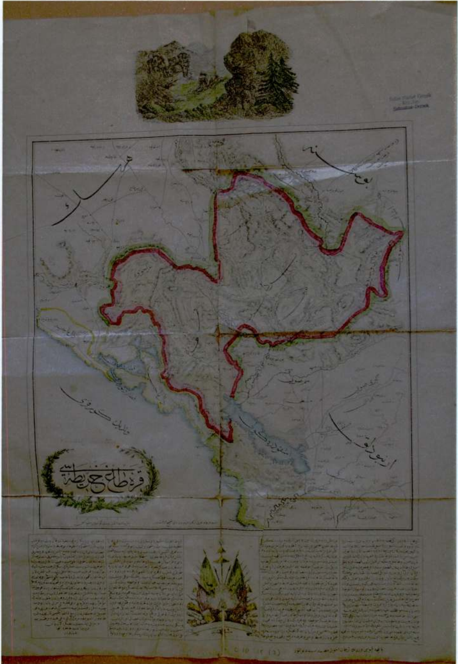
Harita 2: 1862 Karadağ Harekâtını anlatan Karadağ Haritası.