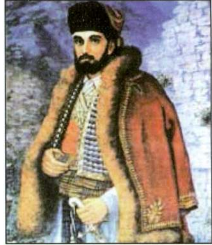
Resim 3: Danilo Petrovic Njegos (1697-1735)