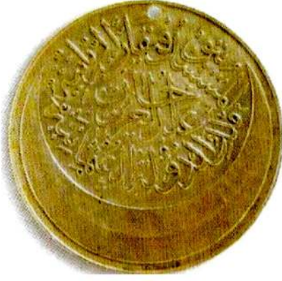
Resim 16: Karadağ Madalyası. Ön Yüz.