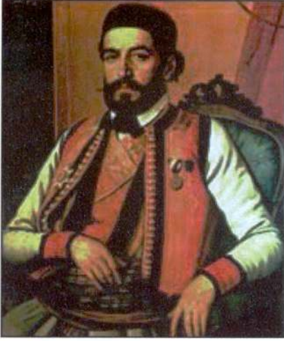
Resim 5: Petar II Petrovic Njegos (1830-1851)