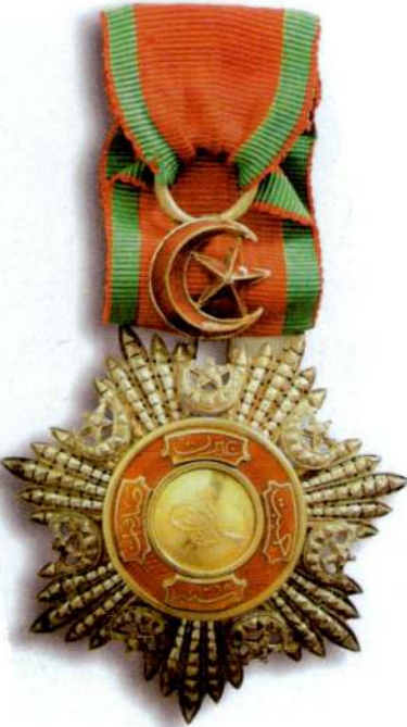
Resim 14: Dördüncü Rütbe Mecidi Nişanı.