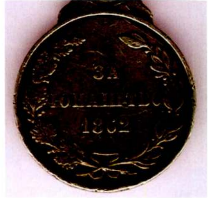
Resim 19: Karadağ tarafından bastırılan "1862 Cesaret Madalyası" arka yüz. Kaynak, Mehmed Subhî, a.g.e. , s. 80, 91, Levha: 5; http://www.medal-medaille.com .