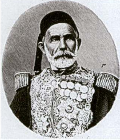
Resim 1: Rumeli Ordu Müşiri Ömer Lütfi Paşa Latas. Kaynak: Sedes, a.g.e. , s. 52.