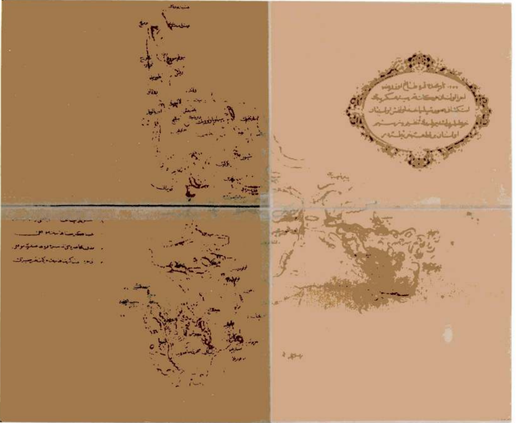
Harita 1: 1862 Karadağ Seferi'nde Askeri Hareketliliğe Sahne olan yerler (Detay). Erkân-ı Harbiye Dâiresi, 1291, Kaynak: Milli Kütüphane: HRT 1994 D 1851 , Demirbaş No: 2961.