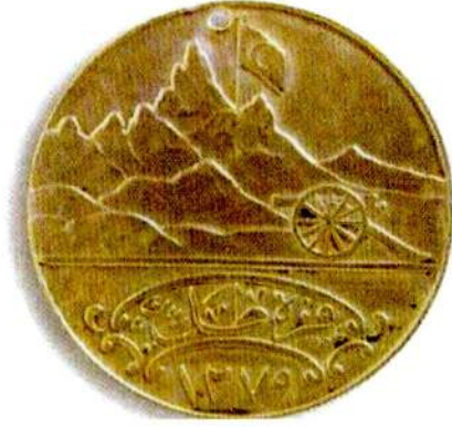
Resim 17: Karadağ Madalyası. Arka Yüz.