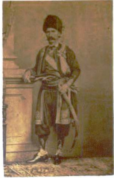
Resim 7: İşkodra Antlaşması'nda sorun olan Vladika Nikola'nın babası Mirko Petrović.