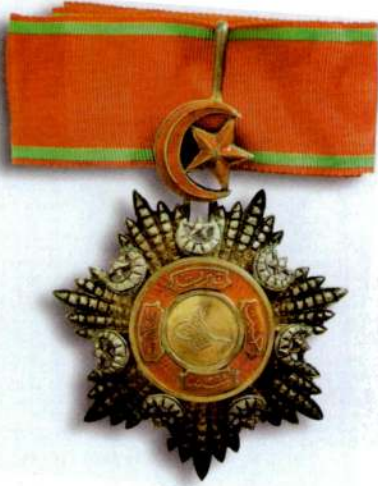
Resim 13: Üçüncü Rütbe Mecidi Nişanı. Kaynak: Eldem, a.ge. , s. 194.