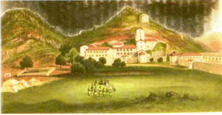
Resim 12: 1863'de Karadağ'ın idare merkezi Çetine.