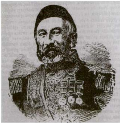
Resim 2: Bosna Ordu Komutanı Derviş Paşa. Kaynak: Sedes, a.g.e. , s. 92.