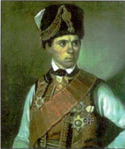
Resim 6: Danilo (1852-1860)