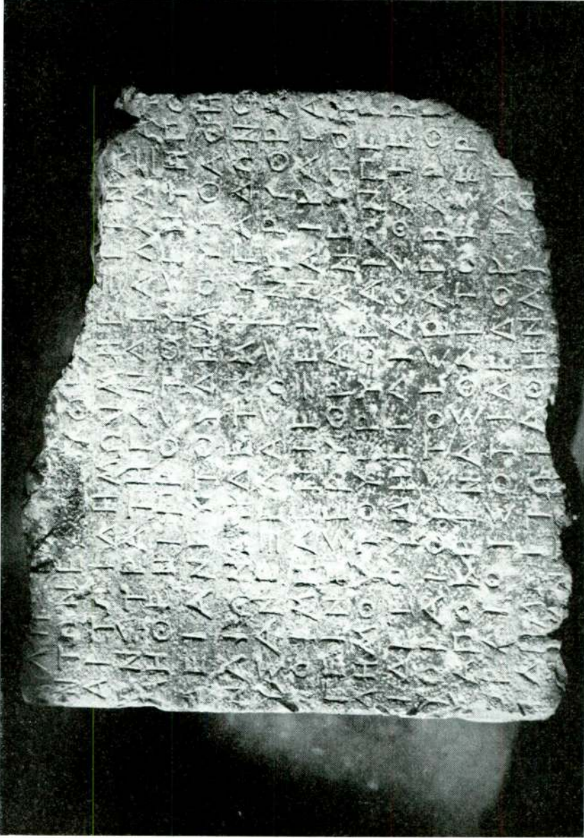
Erythrai için attik dekret / Ein attisches dekret für Erythrai