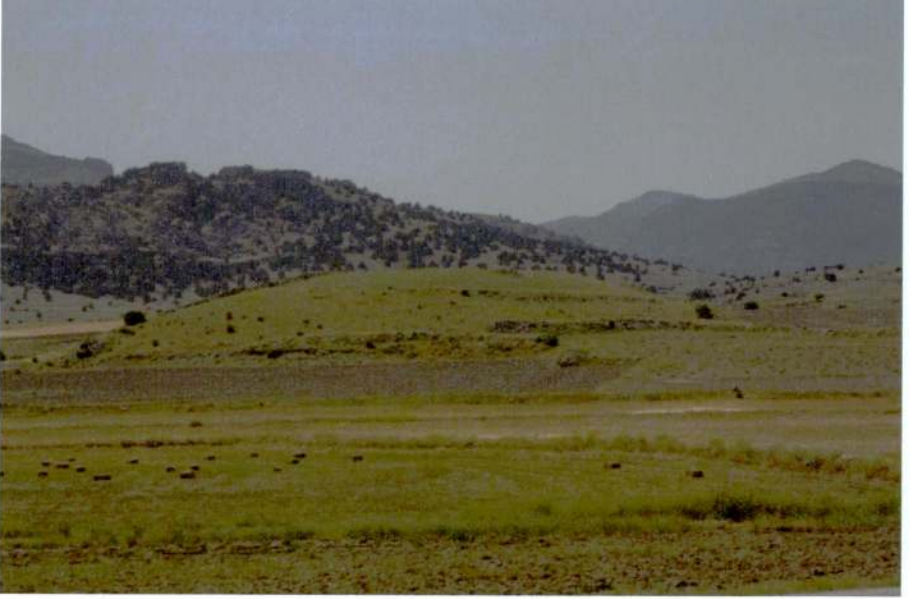
Resim 7: Tezköy Höyük