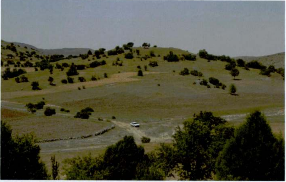
Resim 5: Kırkel Mevkii