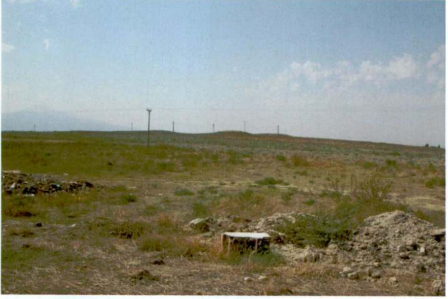
Resim 1: Üçhöyük (Bolvadin Höyük)