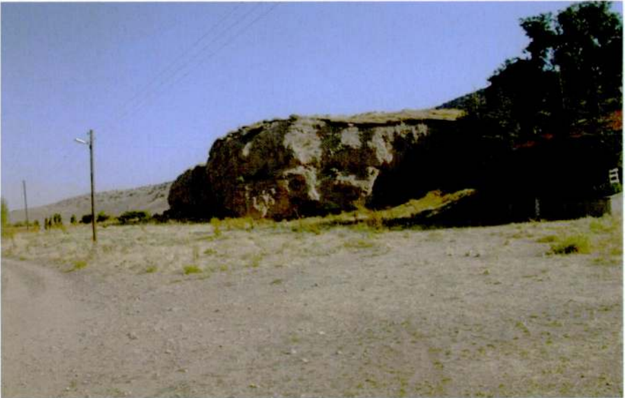
Resim 4: Bağlıca Höyük