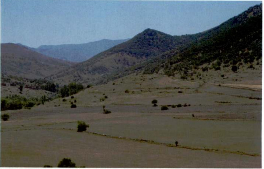
Resim 2: Tekdeğirmen Mevkii