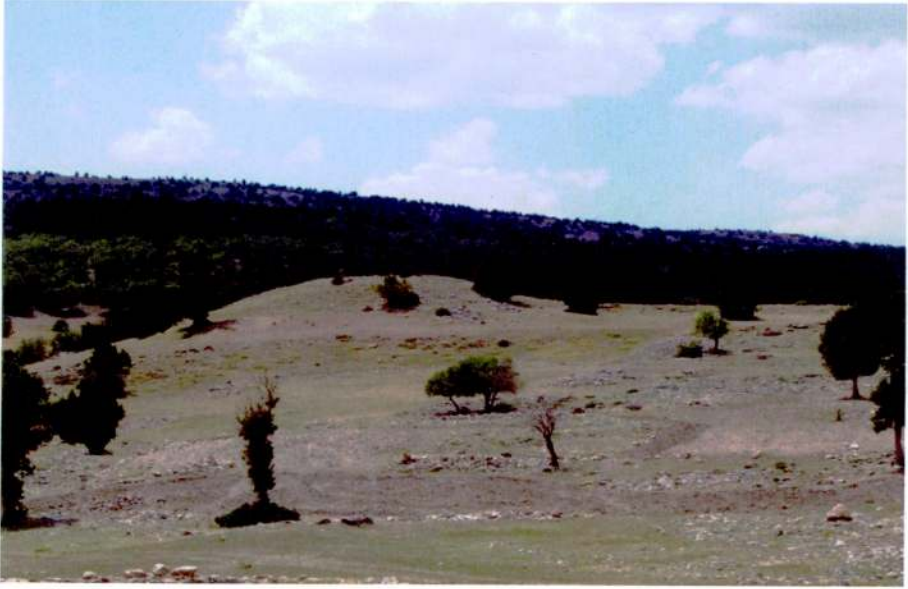
Resim 12: Muratkoru Hyk