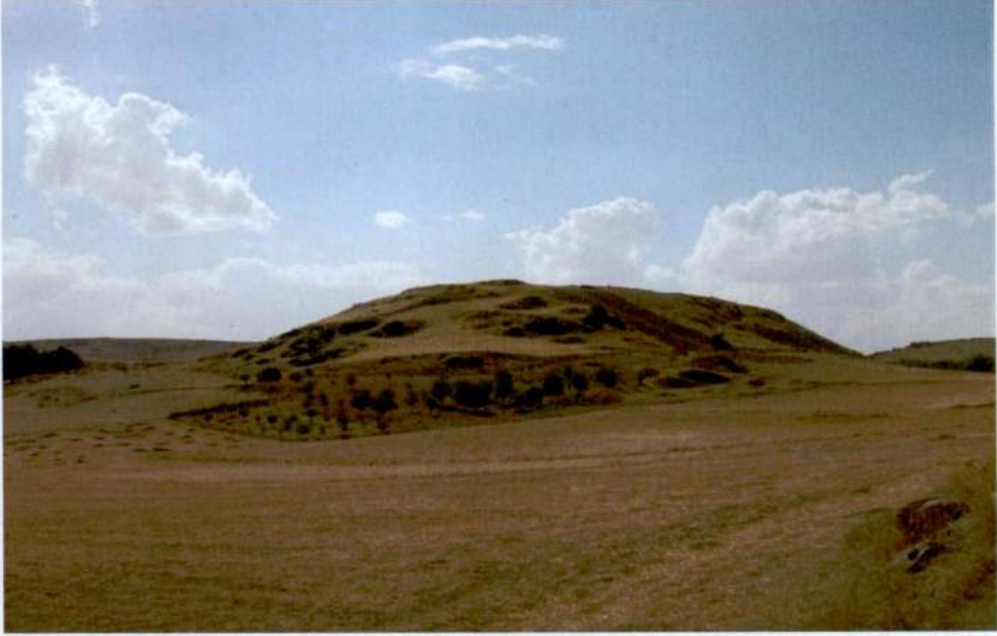
Resim 9: Köy Kalesi