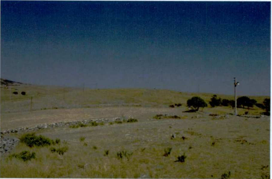
Resim 6: Akçaşar Höyük