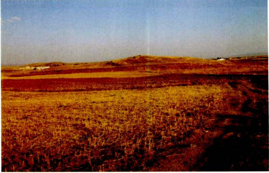
Resim 13: alıřlar Hyk