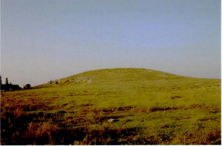
Resim 3: Çayır Höyük