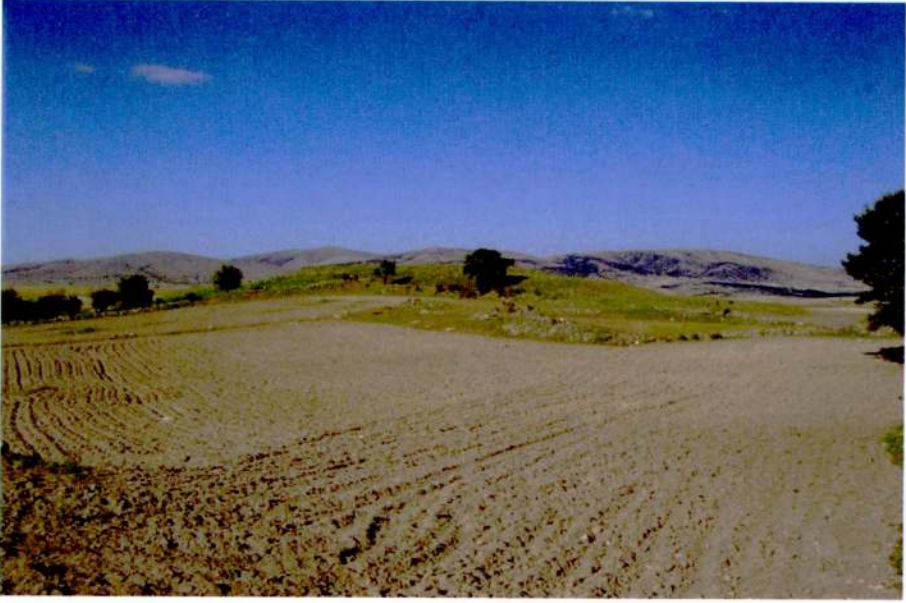
Resim 11: Ahaların eşme