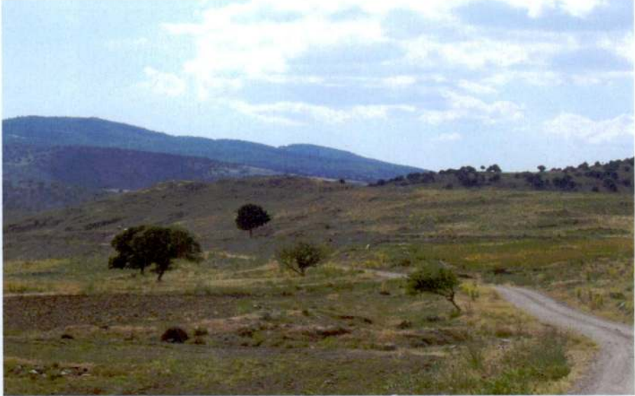
Resim 10: Asarcık Höyü