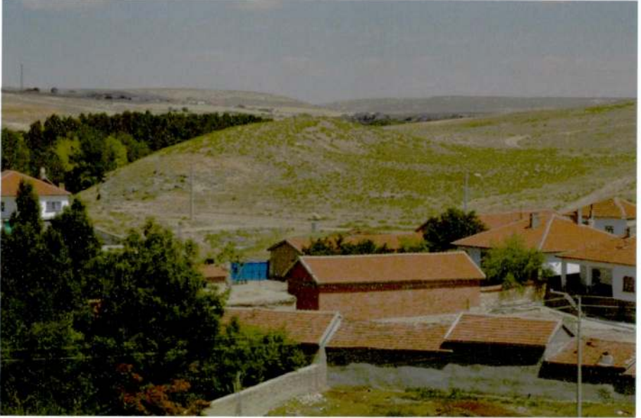
Resim 8: Aşağıpiribeyli-İnli Höyük