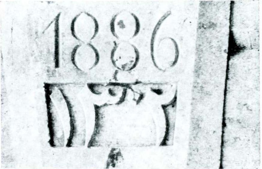
Res. 3 — Karadeniz Ereğlisi'ndeki çeşme parçalarından