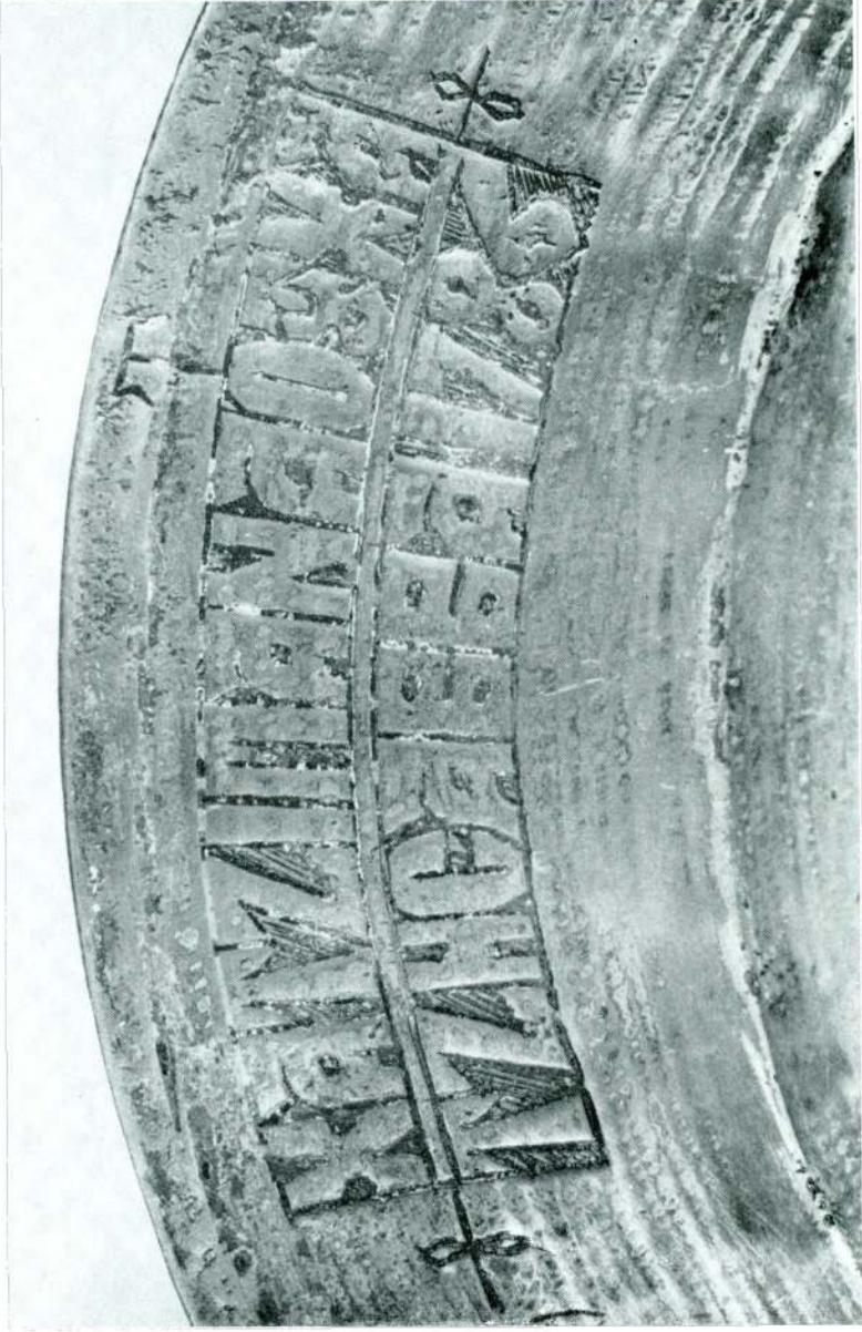
Res. 9 — Bir bakır tabak üzerindeki yazı