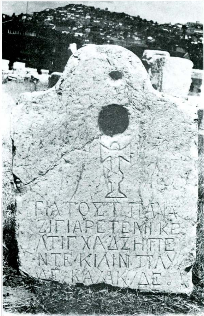
Res. 5 — Ankara Hamam Müzesindeki mezartaşı