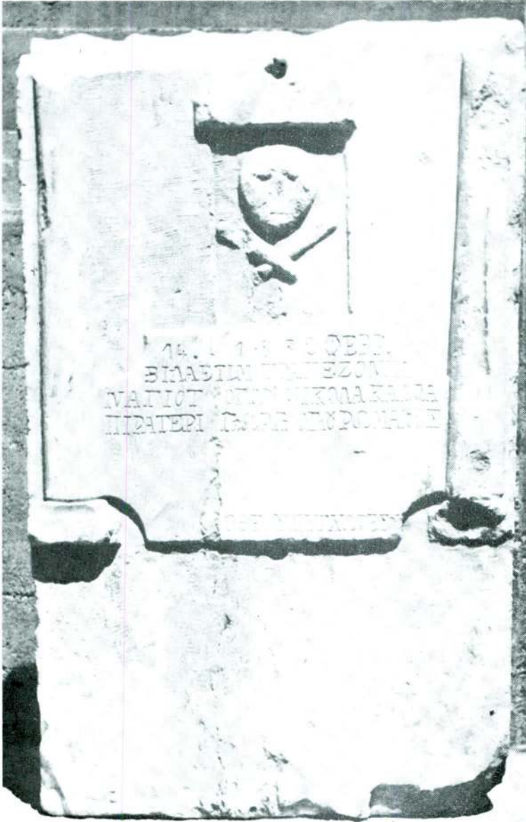
Res. 6 — Silifke Müzesinde Romanos'un mezar taşı