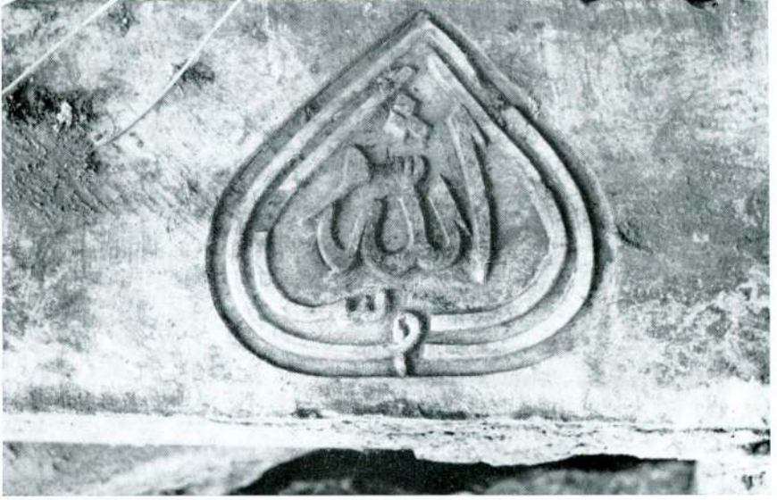
Res. 2 — Karadeniz Ereğlisi'ndeki çeşme parçalarından