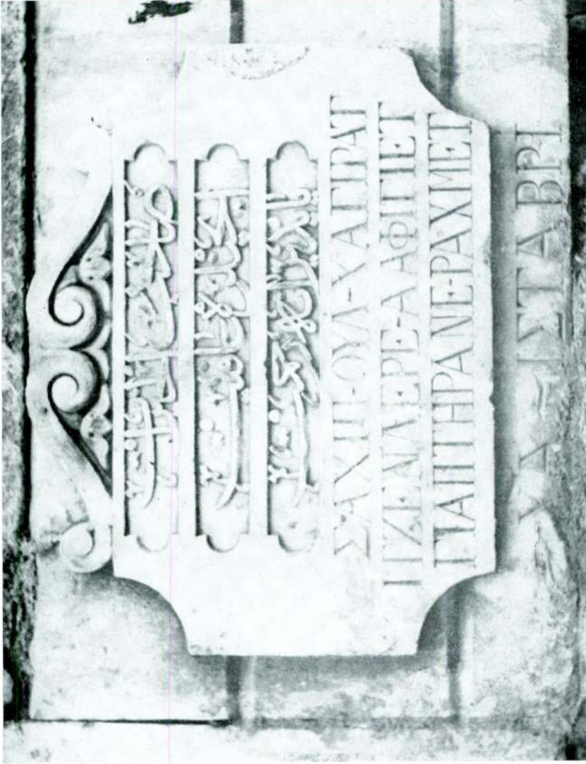
Res. 1 — Karadeniz Ereğlisi'nde çeşme kitabesi