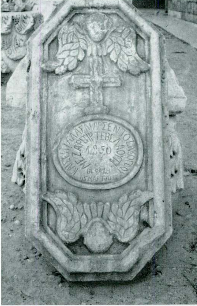
Res. 4 — Silifke Müzesinde Arsen Tozakoğlu'nun mezartaşı