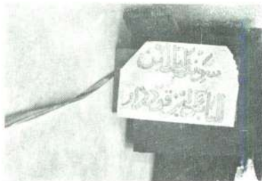
← Res. 3