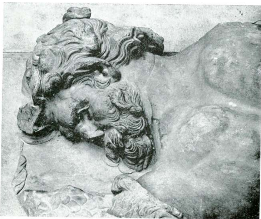
Abb. 9 — Pergamonaltar, Ostfries, Detail, Berlin Pergamonmuseum