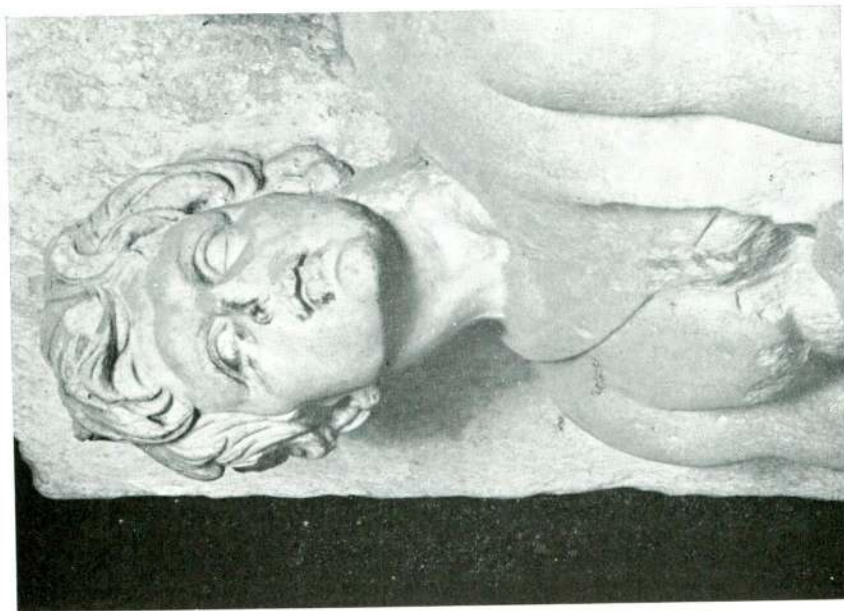
Abb. 10 — Reiterrelief aus Salomiki, Detail, Istanbul Museum