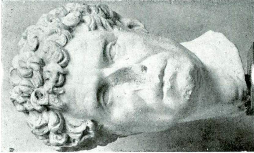
Abb. 15 — Bildniskopf aus Tralles, Boston Museum