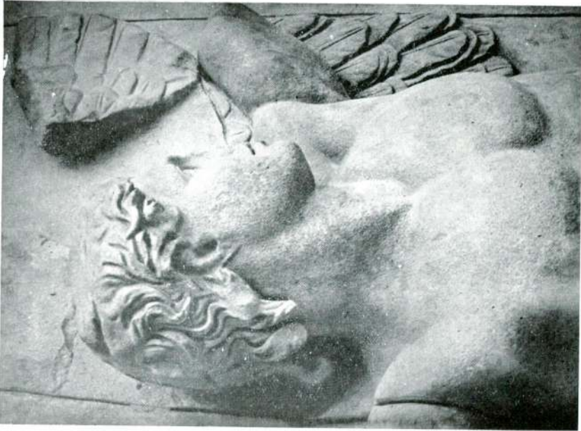
Abb. 13 — Pergamonaltar, Nordfries, Detail, Berlin Pergamonmuseum