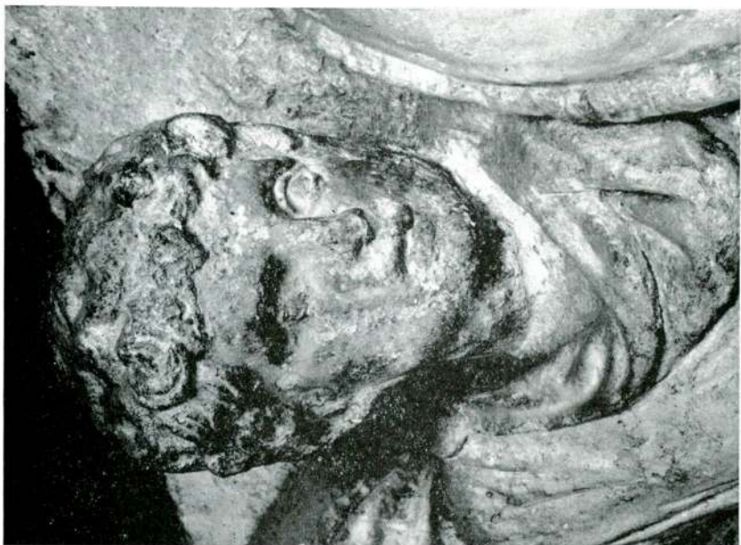
Abb. 4 — Reiterrelief aus Saloniki, Detail, Istanbul Museum; Abb. 5 — Reiterrelief aus Saloniki, Detail, Istanbul Museum