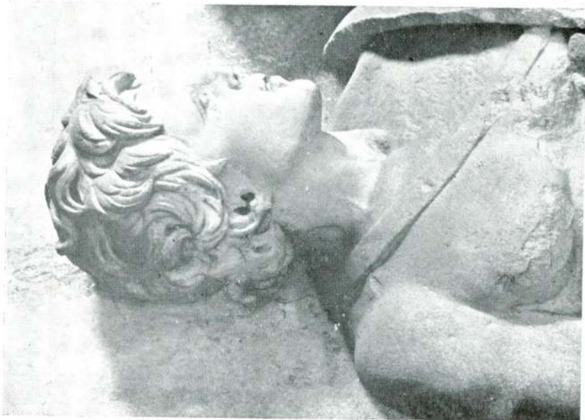
Abb. 12 — Reiterrelief aus Saloniki, Detail, Istanbul Museum