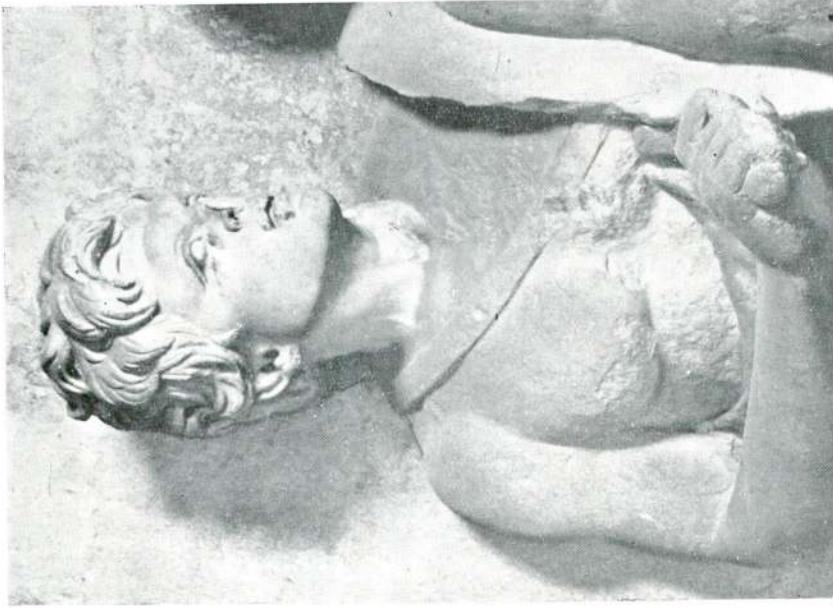
Abb. 7 — Reiterrelief aus Saloniki, Detail, Istanbul Museum