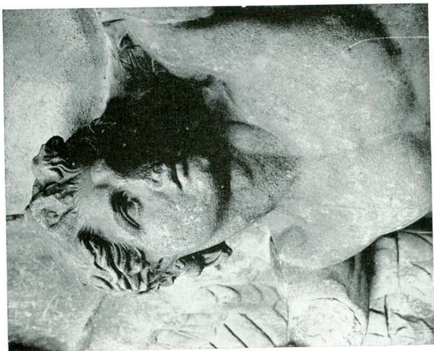
Abb. 11 — Pergamonaltar, Nordfries, Detail, Berlin Pergamonmuseum