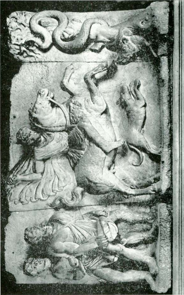
Abb. 1 — Reiterrelief aus Saloniki, Istanbul Museum