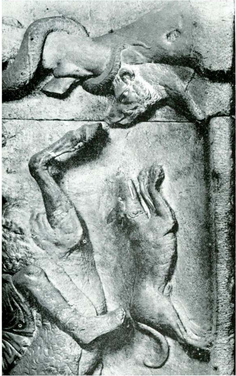
Abb. 2 — Reiterrelief aus Saloniki, Detail, Istanbul Museum