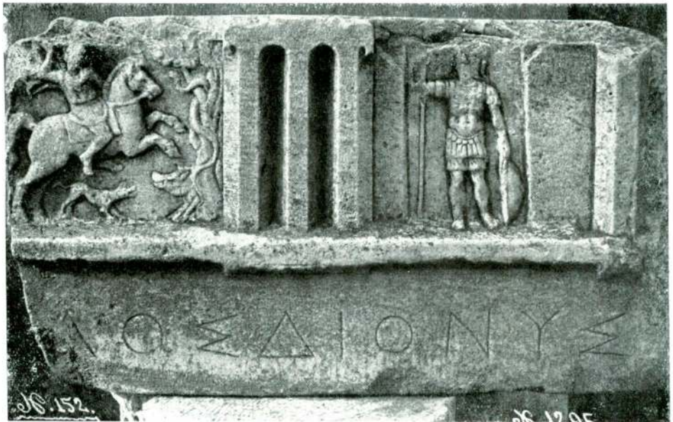
Abb. 17 — Architekturfragment aus Thasos, Istanbul Museum