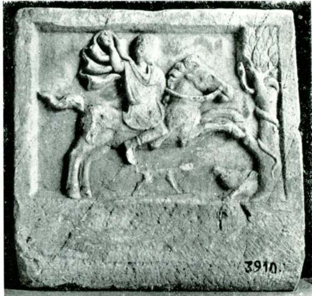
Abb. 16 — Reiterrelief aus Istanbul, Museum İstanbul