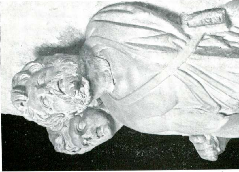
Abb. 6 — Reiterrelief aus Saloniki, Detail, Istanbul Museum