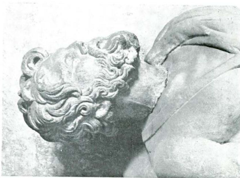
Abb. 8 — Reiterrelief aus Saloniki, Detail, Istanbul Museum