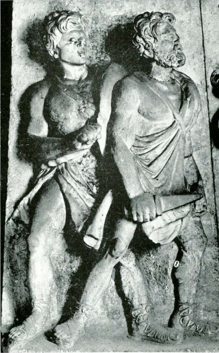
Abb. 3 — Re terrelief aus Salon ki, Detail, Istanbul Museum