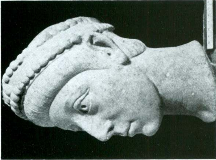
Portre'nin yandan ve arkadan görünüşü.