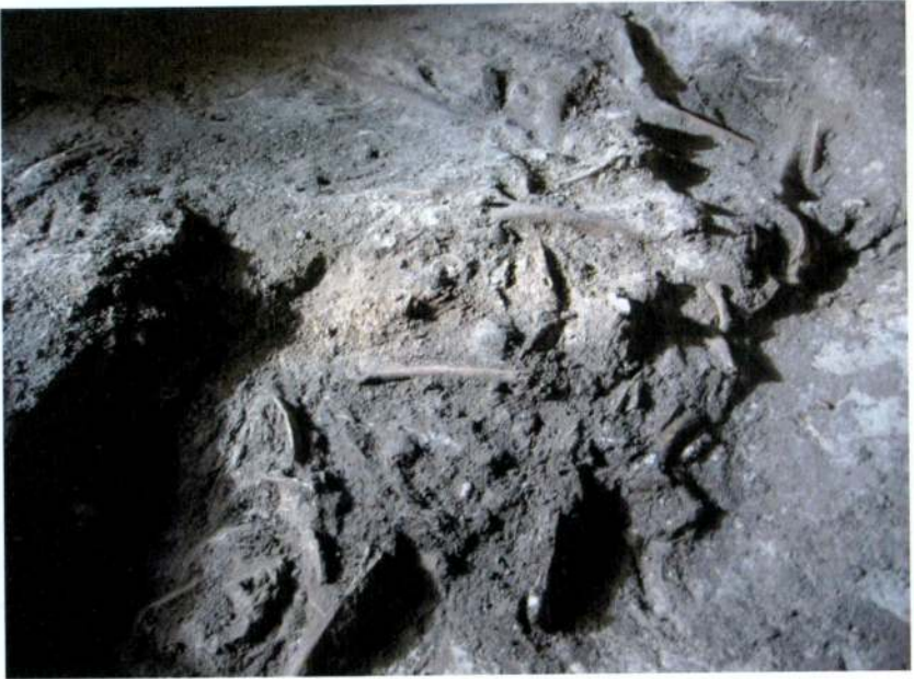
Resim 1: Van Kalecik (Urartu) Mezar Odası