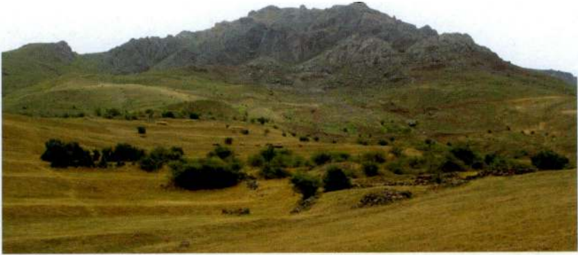
Resim 2. Kurom Maden Merkezi