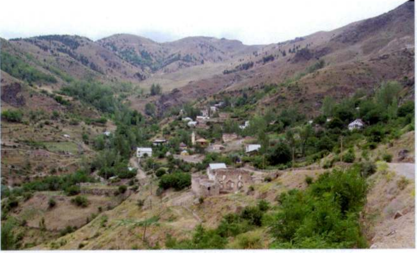
Resim 1. Eski Şehir-Canca