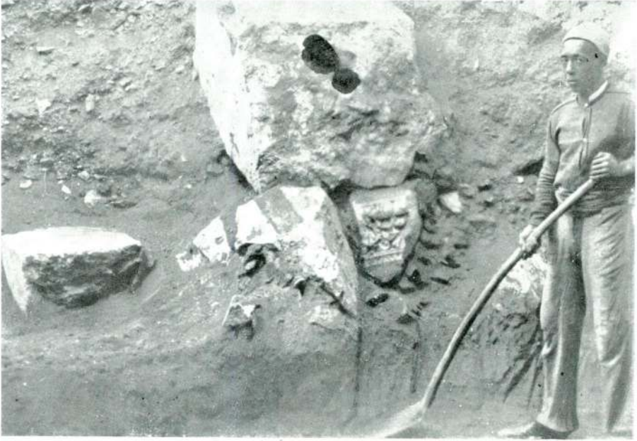
Resim : 5