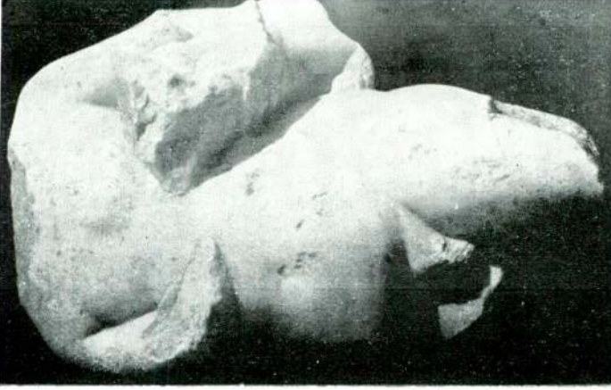
Resim : 6 a