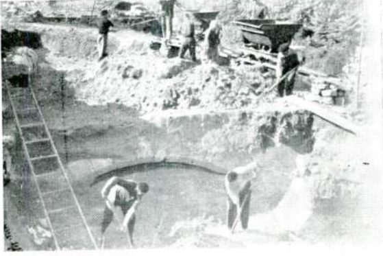
Resim : 3