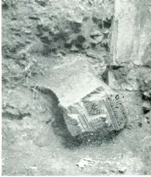
Resim : 7