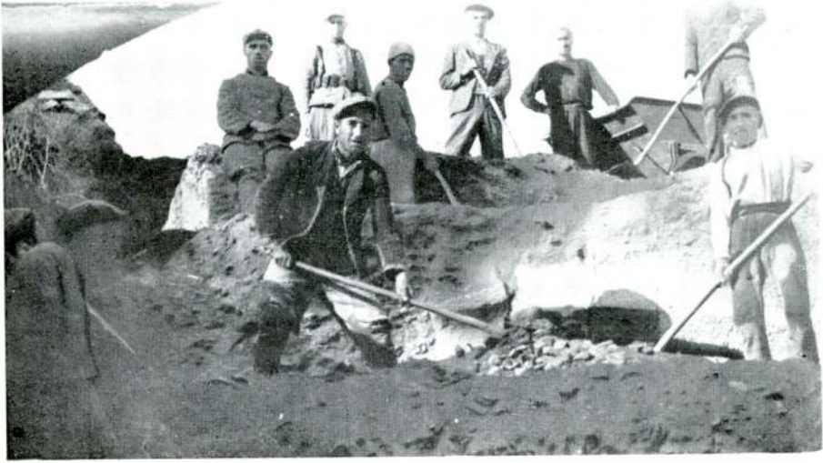
Resim : 1