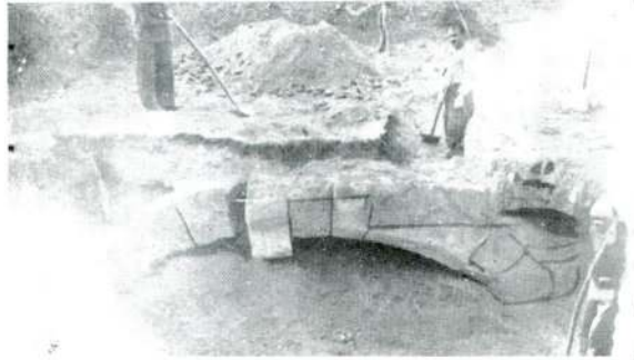
Resim : 2