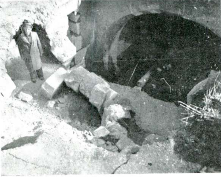
Resim : 4