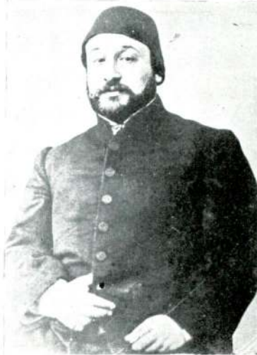
Komite azaları (Hüviyetleri malûm değildir)