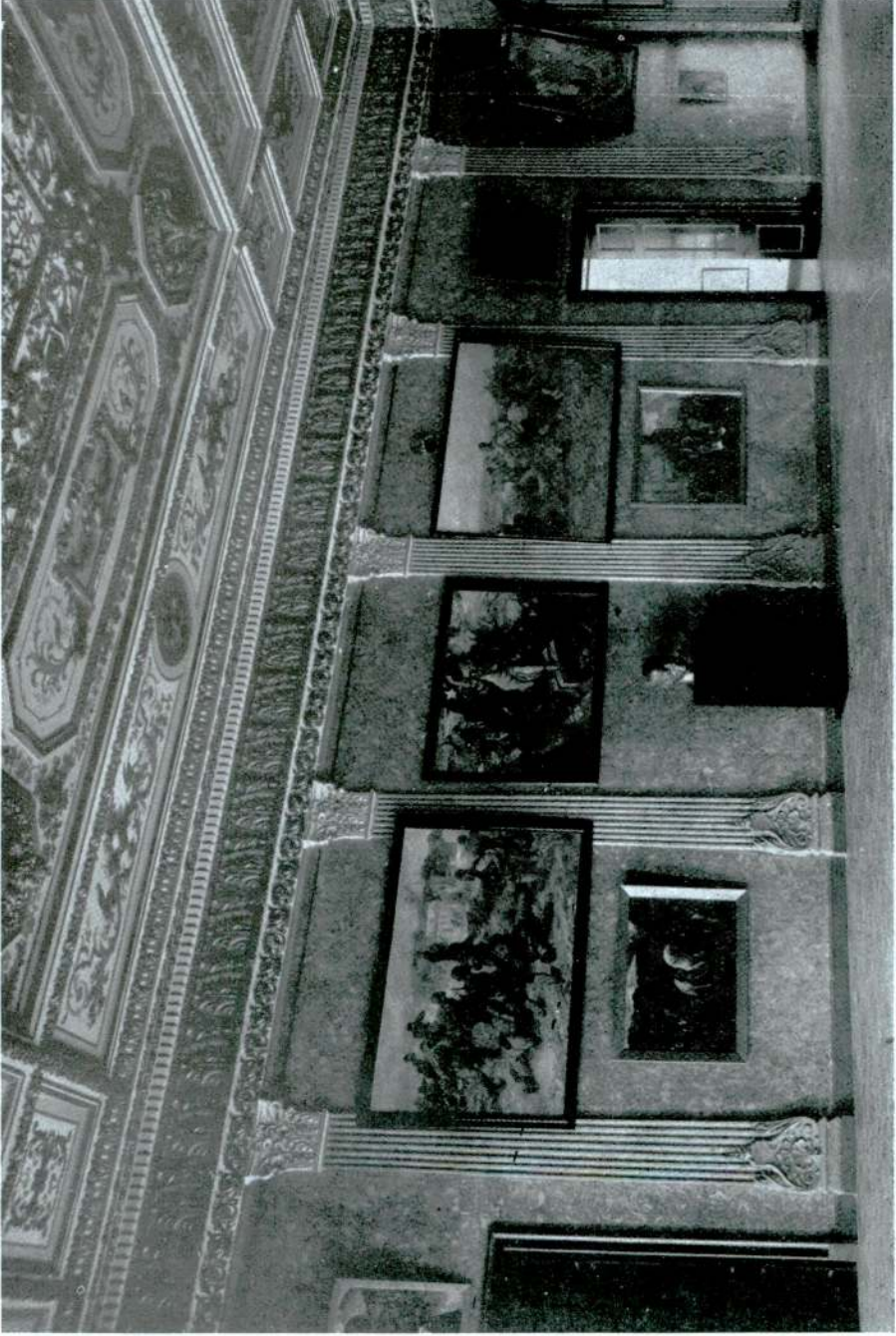
« Resim ve Heykel Müzesi » nde İnkılap Salonu