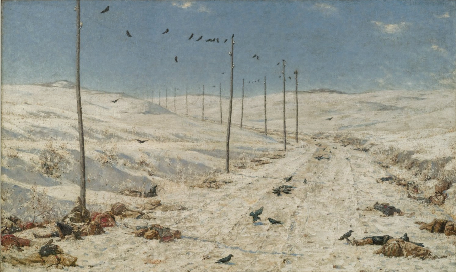
Resim 1: Vasily Vereshchagin (Rus, 1842-1904)'in esir konvoyunun bu yürüyüşünden esinlenerek çizdiği The Road of the War Prisoners (Savaş Esirlerinin Yolu) (1878-1879) isimli tablosu.

Binlerce yırtıcı kuş kafilenin önüne ve arkasına üşüşerek sefil kafileyi acımasız bir şekilde tıpkı batmakta olan bir geminin etrafındaki köpekbalıkları gibi takip etmekteydi. Birkaç metre ileride, yarısı karla kaplı ve üzerindeki eskimiş elbiseleri, biraz daha sıcak kalabilme gayesiyle arkadaşları tarafından alınmış, başka bir Türk'ün çıplak bedeni uzanıyordu. Leşçil bir karga ölmüş bir esirin eline henüz konmuştu ve köpekler kurbanlarının etrafında dönüyorlardı. Birkaç adım ötede hızla yağın kar nedeniyle yüzü gökyüzüne sabit bir şekilde bakan ve hayata gözlerini yummuş diğer bir sefil esiri bize getirdiler. Şimdi bir köyün yanındayız, bir köpek ile domuz arasındaki soğuk cesede ilk hangisinin ulaşacağına karar vermek için yapılan dalaşmaya şahit olduk. Burası Putinein köyüydü ve köy neredeyse kar ve buzun içinde kaybolacaktı. Bu köy, Tuna'nın en iyi geçiş noktası olarak bilinen Dragomiroff'u ararken, ilk kez yaz başında geçtiğim zamanki görüntüsünden ne kadar farklı görünüyordu. O zamanlar sivrisineklerden, bunaltıcı sıcaktan ve kör edici tozdan muztarıptık, şimdi ise soğuktan dolayı kürklerimizde titriyoruz. 12