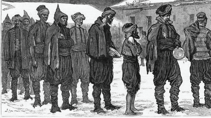
WAITING FOR BREAKFAST