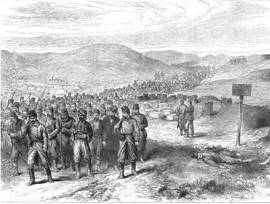
TURKISH PRISONERS ON THE ROAD FROM PLEVNA. FROM A SKETCH BY G. WOODFORD, TAKEN BY MISS FOSTER OF BULGARIA.