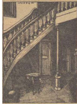
Ek 5: Kuzguncuk Ahmed Fethi Paşa Yalısının Dıştan ve İçten Görünümü