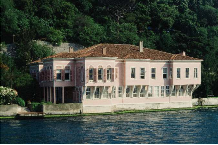
Ek 4: Kuzguncuk'ta Ahmed Fethi Paşa Yalısı