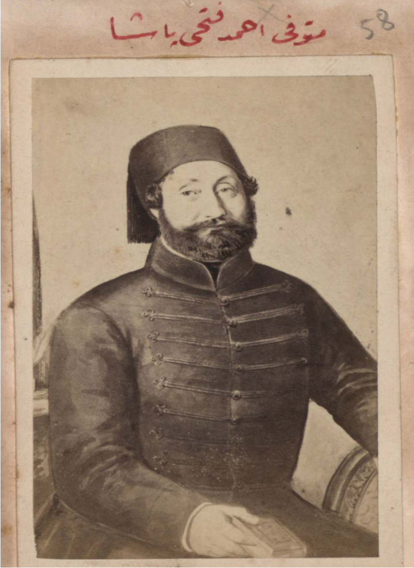
Ek 1: Damat Ahmed Fethi Paşa