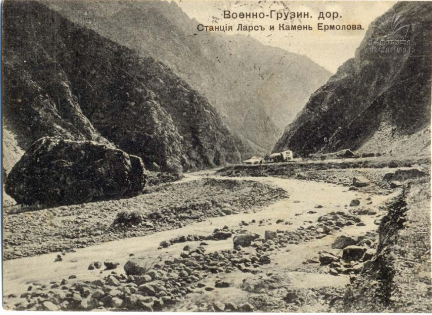
Resim 3: Gürcü Askerî Yolu -Lars İstasyonu ve Yermolov Taşı