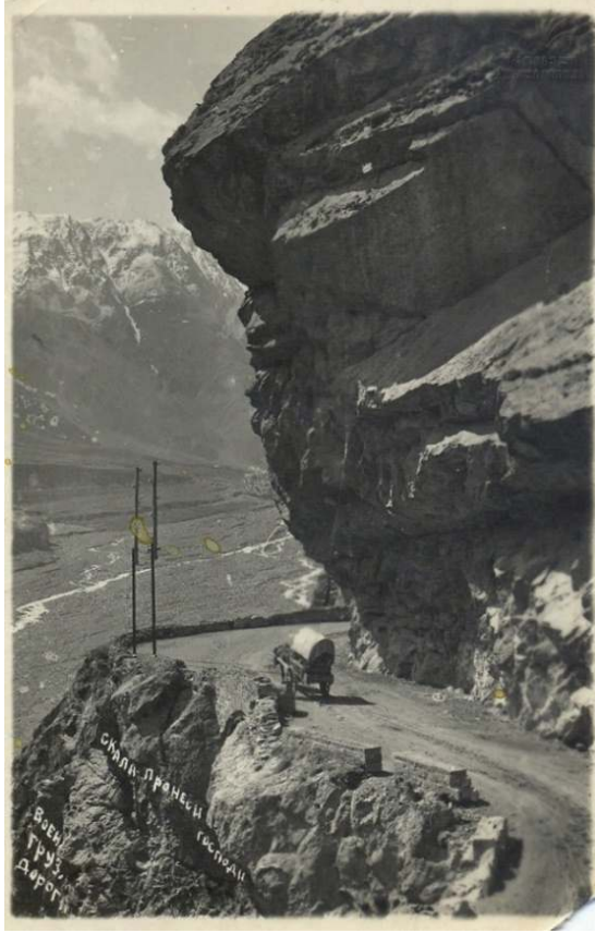
Resim 2: 19. Yüzyılda Gürcü Askerî Yolu'nun Görünümü