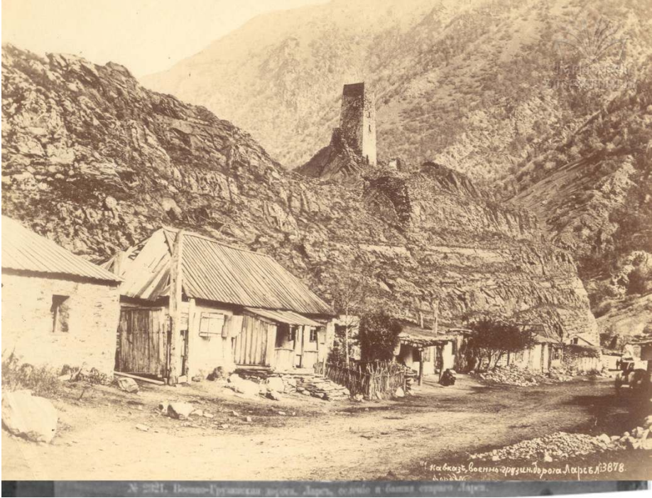
Resim 4: Lars'ta bir Savaş Kulesi