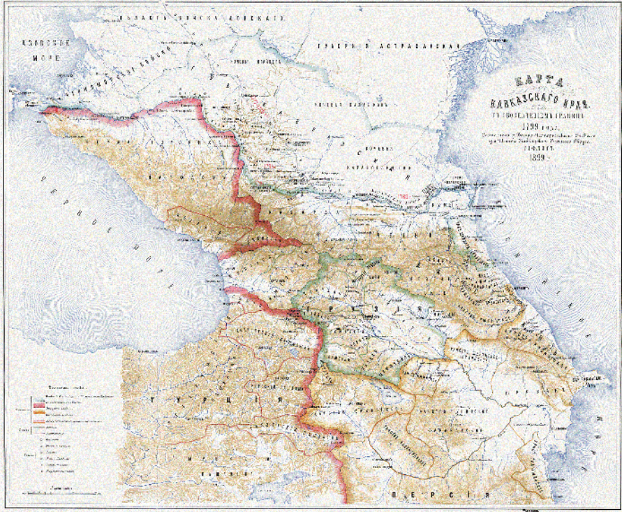
Harita 1: 19. Yüzyıl Başlarında Kafkasya