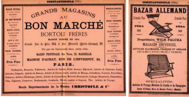
Resim 1: Bon Marché ve Bazar Allemand ilanı.

eden ülkeler olarak oyuncak pazarına hâkimdi 30 . Avrupa, oyuncakçılık sahasında ki gelişmişliğini göstermek için sergiler ve yarışmalar da düzenlerdi 31 .