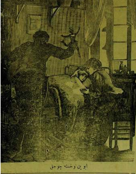
Resim 5: Hasta çocuklarıyla ilgilenen bir aile.

Defteri adlı dergi, sözü edilen yılda dönemin çocuklarına oynadıkları millî oyun ve oyuncaklarımızı sorup gelen cevapları yayınlıyarak bugüne çok değerli bilgiler bırakmıştır. Çocukların oynadığı oyunlar listesinden oyun nesnesi ve oyuncaklar ayrımını yapmak, her bir oyunun nasıl oynandığını bilmek pek kolay değildir. Ayrıca millî oyuncaklarımız başlığı altında verilen bazı oyuncaklar, oyunlar listesinde de görülmektedir. Bir fikir olması açısından uzun oyun listesi içerisinde oyuncak veya oyun nesnesi olarak değerlendirilebilecek olanlar şunlardır: ip atlama, uçurtma, aşık, beş taş, bebek, tahterevallı, ceviz, çelik çomak, çember çevirme, topaç, top, fincan, yüzük, kaydırak, kukla, kızak. Gelen cevaplara göre çocukların oynadığı millî oyuncaklar şunlardır: ok- aşık kemiği, uçurtma, bal mumu ördek, cirit, çelik çomak, çember, dürlüce (ağaç dalından düdüük), davul, def, zurna, sapan, topaç, tabanca, zıpzıp, kalkan, kaniç?, kırbaç, kızak, kargı, kaval, kement, güz, mızrak . Eyüp oyuncaklarından da beşik, kursaklı düdüük, hacıyatmaz, kocakarı zırlıtısı, aynalı testi ve çocuk arabasıyla oynadıkları görülmektedir 70 .