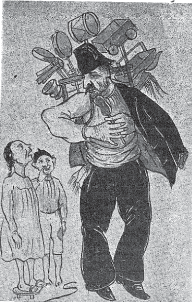
Resim 4: Sermet Muhtar Alus tarafından Tarih Hazinesi için çizilmiştir.

19. yüzyılda seyahatname, hatırat ve süreli yayımlarla artan kaynak çeşitliliğiyle Eyüp oyuncaklarına dair daha fazla bilgi edinilebilmektedir. Yazdığı masallarıyla ünü Danimarka dışına yayılan Hans Christian Andersen’in 1841 yılı başlarında geldiği İstanbul’da Züleyha adında bir çocuğun elinde gördüğü at şeklindeki bir