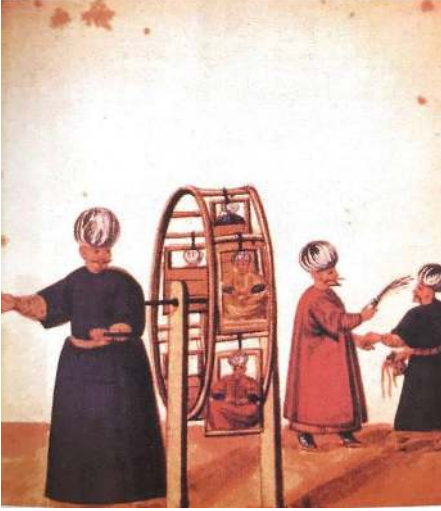
Resim 2: 16. yüzyıla ait bir dönme dolap. Kaynak: Metin And, Oyun ve Bügü , s. 568.