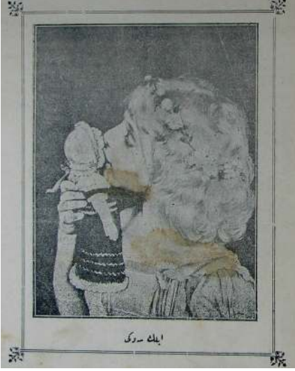
Resim 6: Oyuncak bebeğine sevgi gösteren bir çocuk.

hakkıdır kaidesine işlerlik kazandırdığı vurgulanır. Ancak özellikle amaca uygun oyuncaklar seçilmesi, zehirli olma ihtimali bulunan yeşil ve kırmızı renklilerden uzak durulması uyarısı yapılarak ailelerin bu konuda dikkatli olması istenir 91 .