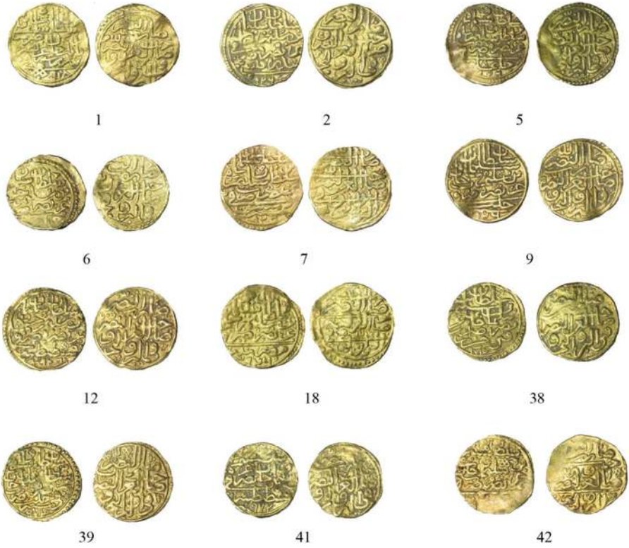
Resim 1: Osmanlı Sikkeleri