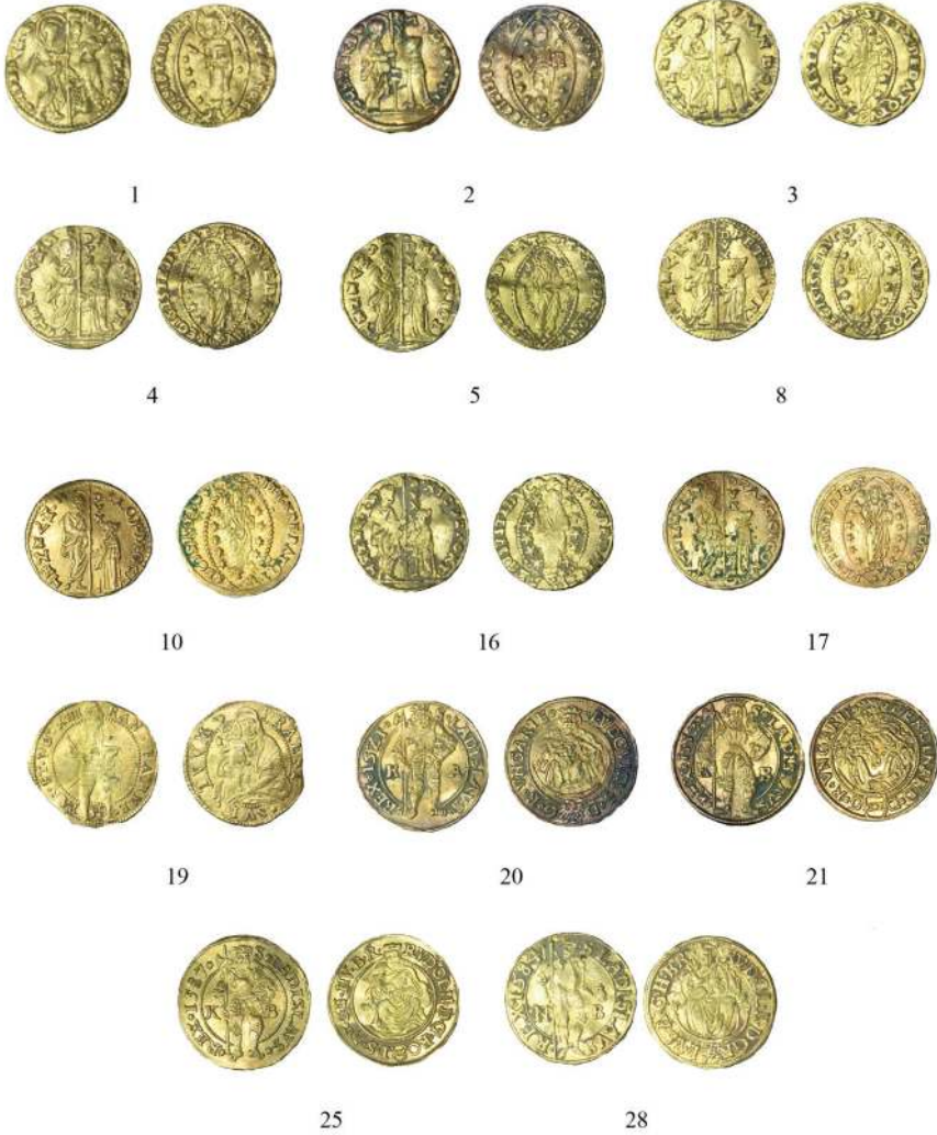
Resim 3: Avrupa Devletleri Sikkeleri