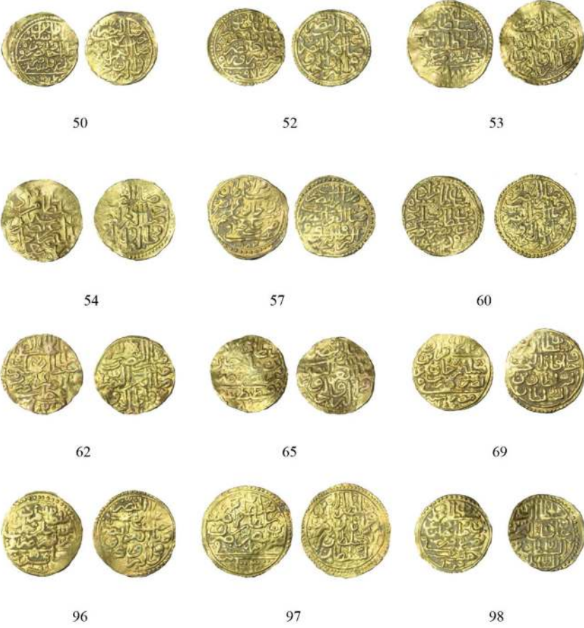
Resim 2: Osmanlı Sikkeleri