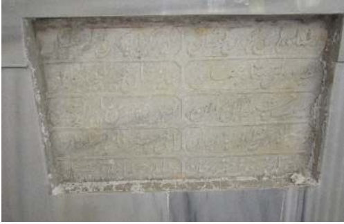
Resim 11: Selim Geray Sultan'ın kızı Fatma Sultan'ın çeşme kitabesi Oklalı köyü camii gasilhanelerinin içinde