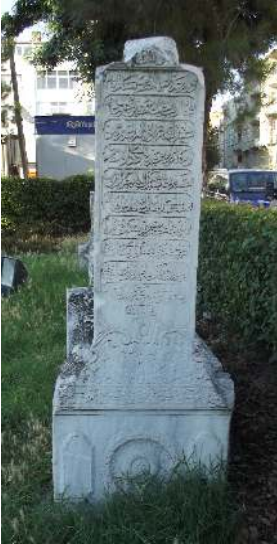
Resim 3: IV. Devlet Geray Han Ramazan 1194 Saray Ayas Paşa Camii haziresi