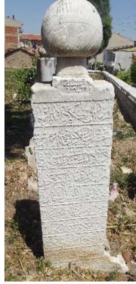
Resim 6: Kalgay Mübarek Geray Sultan (Arslan Geray Han'ın oğlu) 1203 Çelebi Sultan Mehmed Camii (Paşa Camii) haziresi