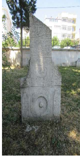
Resim 2: II. Selim Geray Han 1200 Saray Ayas Paşa Camii haziresi