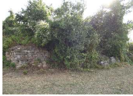
Resim 20: Virbitsa Kasabası, Gerayların Sarayından geriye kalanlar (ikinci avludan görünüş) (2015)