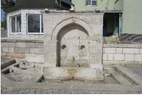
Resim 9: Selim Geray Sultan Çeşmesi Subaşı-Çatalca