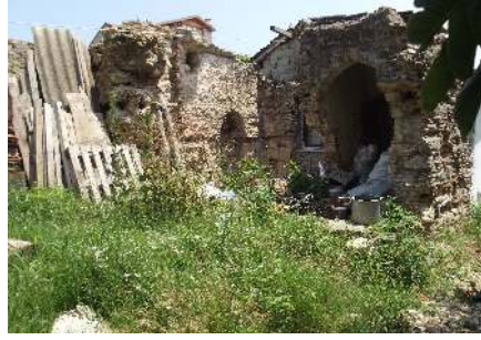
Resim 10: Hamam kalıntısı Subaşı Köyü 15 Haziran 2013