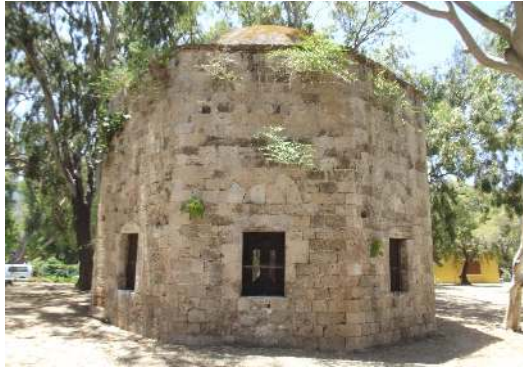
Resim 21: Camibek Geray Han türbesi Murat Reis Mezarlığı Rodos (23.6.2013)