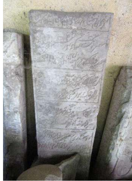
Resim 16: Salih Geray Sultan'ın mezar taşı (İslimye Bölge Tarih Müzesi, 2016)