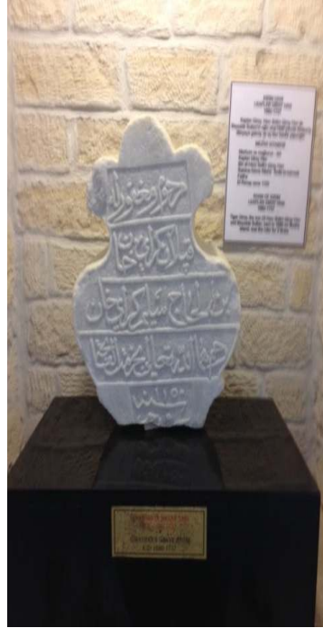
Resim 12: I. Kaplan Geray Han'ın baştaşı- Çeşme Kalesi müzesi