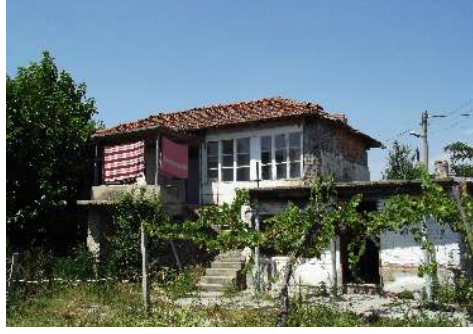
Resim 18: Athoğlu (Konövo) Köyü'ndeki (Yeni Zağra) Geraylara ait konak (2015)