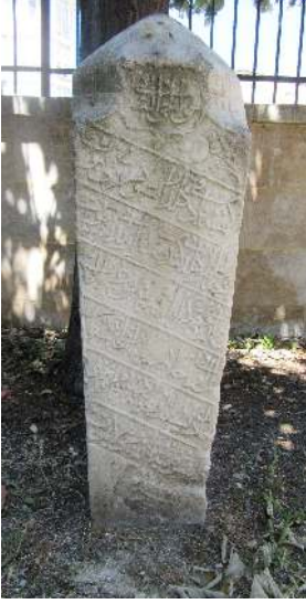
Resim 1: II. Fetih Geray Han 22 Şaban 1159 Saray Ayas Paşa Camii haziresi