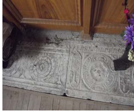
Resim 14: Fındıklı Kilisesi'nin içindeki lahit parçaları (Ağustos 2015)