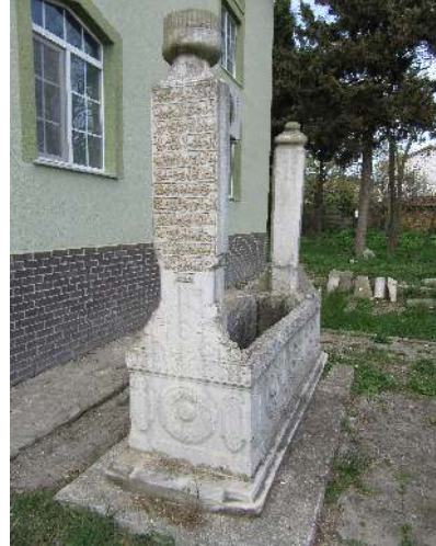
Resim 8: II. Kaplan Geray Han 1185 Subaşı Camii haziresi