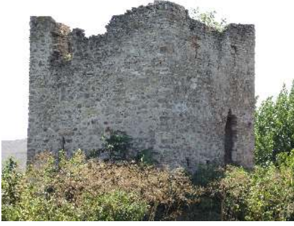
Resim 17: Kule-Athoğlu (Konövo) Köyü (Yeni Zağra)