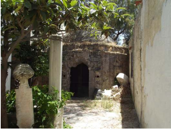
Resim 23: Şahin Geray Sultan ve Fetih Geray Sultan türbesi Murad Reis Mezarlığı Rodos (23.6.2013)