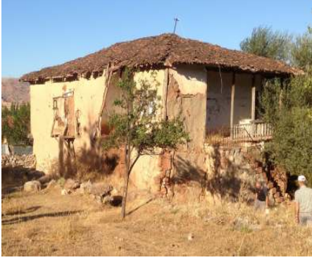
Resim 13: Gerayların konağı-Güzelbeyli Kasabası-Zile