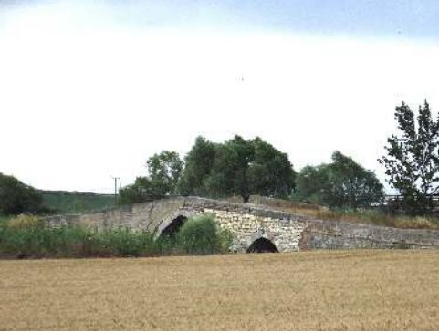
Resim 7: III. Selim Geray Han Köprüsü Karabürçek Köyü (2012)