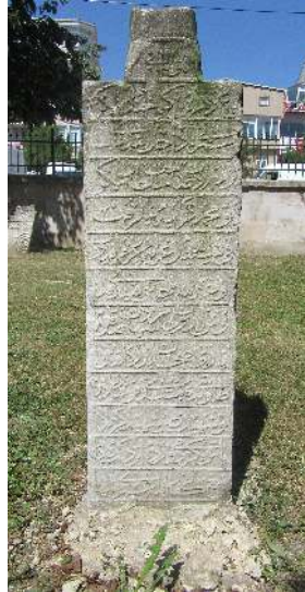
Resim 4: Mehmed Geray Sultan 12. Şehit taşı Saray Ayas Paşa Camii haziresi