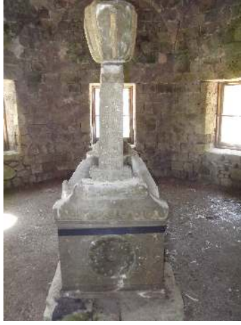
Resim 22: Camibek Geray Han Murat Reis Mezarlığı Rodos (23.6.2013)