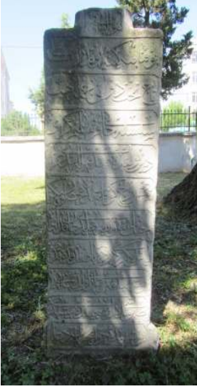
Resim 5: Selim Geray Sultan 1255 Şehit taşı Saray Ayas Paşa Camii haziresi