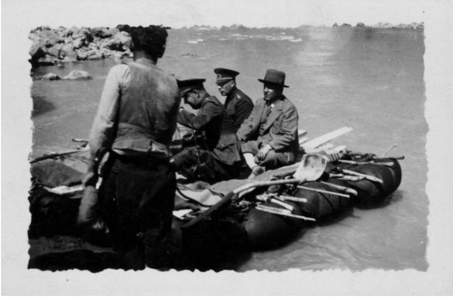
Resim 2: Diyarbakır'da Dicle Nehri üzerinde kelekle yolcu taşımaları (İBB Atatürk Kütüphanesi, Krt. 02440)

Kelek, Dicle nehir yolunun Diyarbakır-Musul arasının kayalık bir yapıda ve hızlı bir akıntıya sahip olması nedeniyle ilk çağlardan Osmanlı Devleti'nin tarih sahnesinden çekilmesine kadar nakliye ve ulaşımda kullanılan yegâne nehir taşıtı olmuştur 2 . Kelekle yapılan ulaşım ve nakliyat, kara yoluna oranla daha güvenli, hızlı, rahat ve ucuzdur. Öyle ki Diyarbakır'dan Mardin'e, oradan da Musul'a uzanan eski posta yolu, 19. yüzyılın ikinci yarısında bile aşılması zor geçitlerden ve taşlıklardan oluşmasının yanında aynı zamanda 3 saldırılara da açıktır. Kara yoluyla 20 günde kat edilen bir mesafe, nehir yolunda kelek vasıtasıyla 5-6 günde kat edilebilmektedir 4 . Öte yandan 19. yüzyılın sonu ile 20. yüzyılın başlarında, kelekle yapılan nakliyat, Musul'a deve ile yapılan nakliye ve taşıma ücretlerinin yarısına, katırla yapılanın ise yedide birine denk gelmektedir 5 .