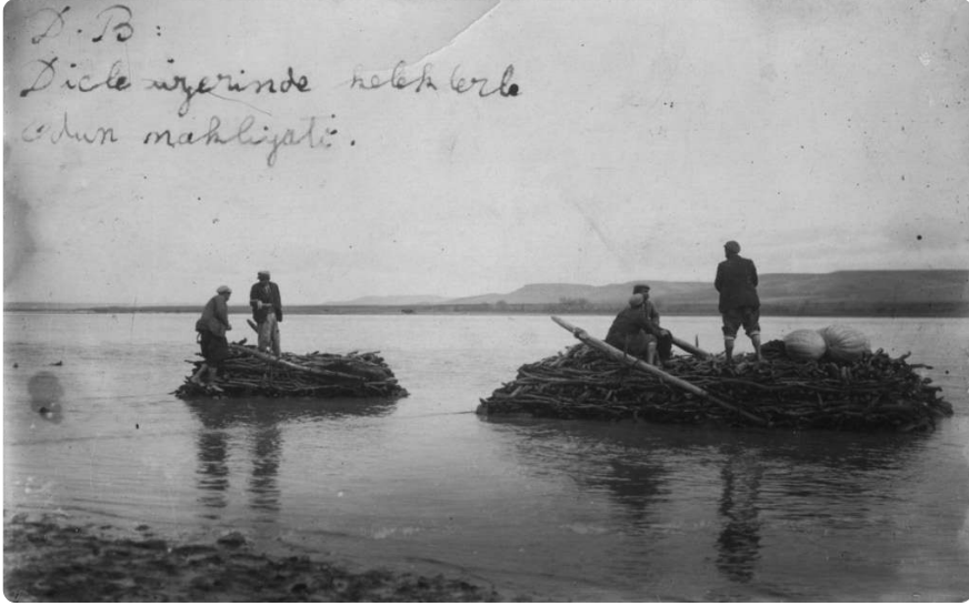
Resim 4: Dicle üzerinde hattâb (oduncu) kelekçileri gösteren bir fotoğraf (İBB Atatürk Kütüphanesi, Krt. 017790.)

kelekçilerden de bahsedilir. Bu kelekçiler nehir yolunun rehberi olup bu anlamda uzman kişilerdir. Evliya Çelebi, Dicle Nehri'nde kelek süren kelekçileri zira anlar mellahân-ı Şatt u Furat'tır. Bu nehrey-ni azimeynin kuşe be kuşe umkunu resâyini ve kurb u bu'dunu cümle karât be-karât bilirler. ifadeleriyle tanımlamaktadır 60 . Bu kelekçiler, nehir yolunun en tehlikeli kısımlarında kelekleri ustaca ve hiçbir zayıata meydan vermeden geçirmeleriyle kayıtlara yansımışlardır. Bazıları da kelekle taşıdıkları yolculara nehir yolunun coğrafyası ve kimi konular hakkında hikâyeler anlatan kişiler olarak kayıtlara konu olmuşlardır 61 . Bu kayıtlardan hareketle, mübalağaya kaçmadan bu kelekçilerin iyi birer anlatı ustası olduğunu söylemek mümkündür.