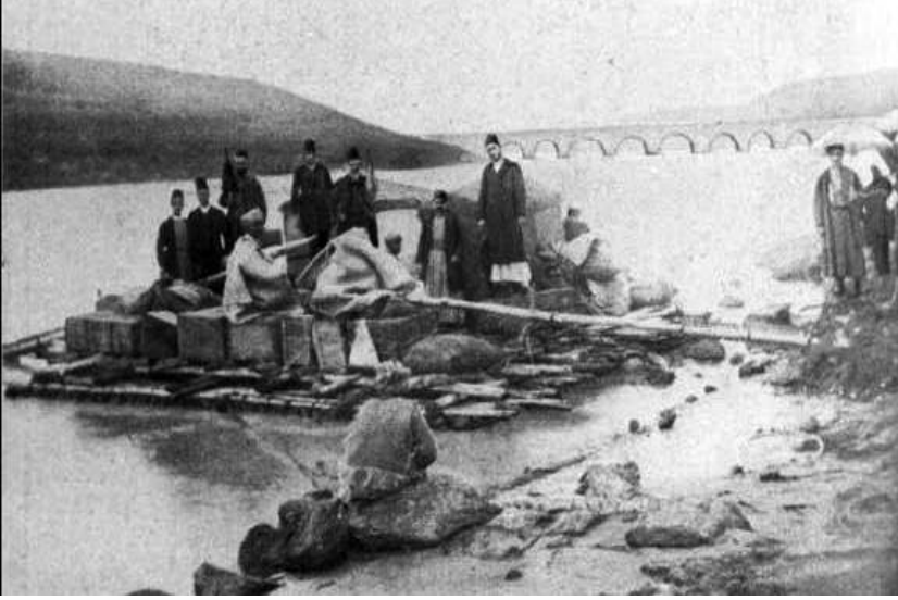
Resim 3: Dicle Nehri'ne açılan kelekçileri gösteren bir fotoğraf

1746'da açtığı davada söz konusu kişilerin eski vali Abdullah Paşa'ya kendisini şikâyet ederek lonca şeyhliğini bir başkasına vermek için vali üzerinden kendisine 514 kuruş ceza verdirdiğini iddia etmiştir 51 . Kayıtlara yansıyan bu örnekte kuyumcular loncasında gayrimüslim üyelerle yöneticiliği yürüten Müslüman şeyh arasında bir sorun olduğu ve bu sorundan kaynaklı olarak gayrimüslimlerin şeyhi değiştirmeye teşebbüs ettikleri anlaşılmaktadır.