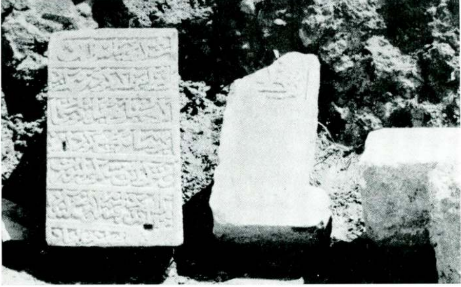
II. Kitabe, motifl: kapı kenarı (?)