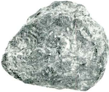
Res. 1 — Ege'den gelen (micoque) el baltası, ön yüz.