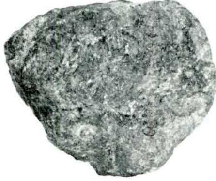
Res. 3 — Ege'den gelen (micoque) el baltası, arka yüz.