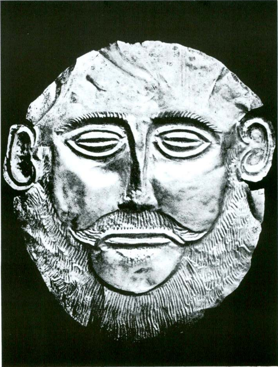
“Anadolu”da bulunan altından yüz maskesi Goldene Gesichtsmaske aus “Anatolien”,