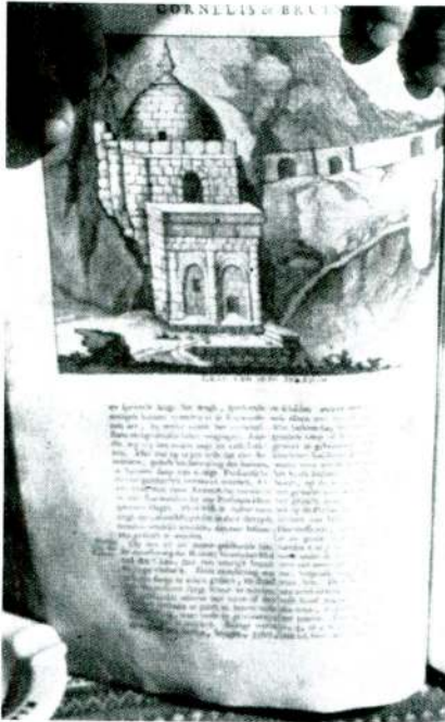
Res. 4 — Seyyit İbrahim türbesi.