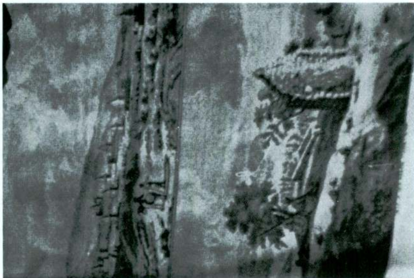
Res. 2 — Üstte (oben) Res. 42 Altta (unten) Res. 44