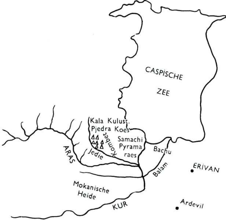
Cornelius De Bruin'in eserinin orijinal nüshası başındaki haritadan büyütülen şema