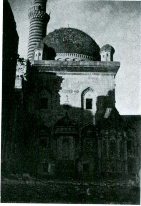
Res. 5 — Doğu Beyazıt'taki İshak Paşa Sarayının camii.