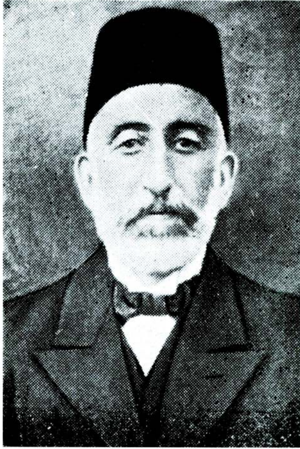
1 — Atatürk'ün ilkokul Öğretmeni Şemsi Efendi ( 1852? — 1916 )