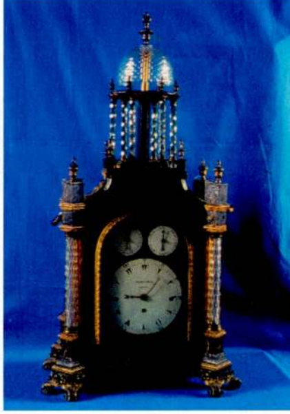
Resim 5 - George Prior markalı müzik çalar masa saati. (Topkapı Sarayı Müzesi.)