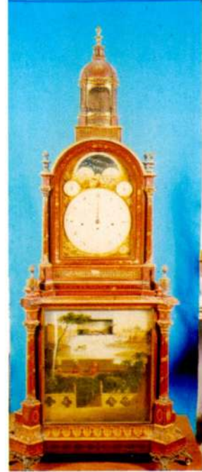
Resim 2 - London Recordon markalı müzikli ve hareketli gemi manzaralı saat. (Topkapı Sarayı Müzesi.)