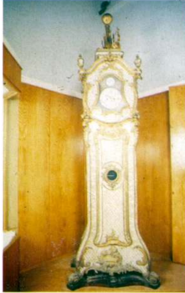
Resim 8 - Markwich Markham, London markalı sedef kakmalı zarflı orglu saat. (Topkapı Sarayı Müzesi.)