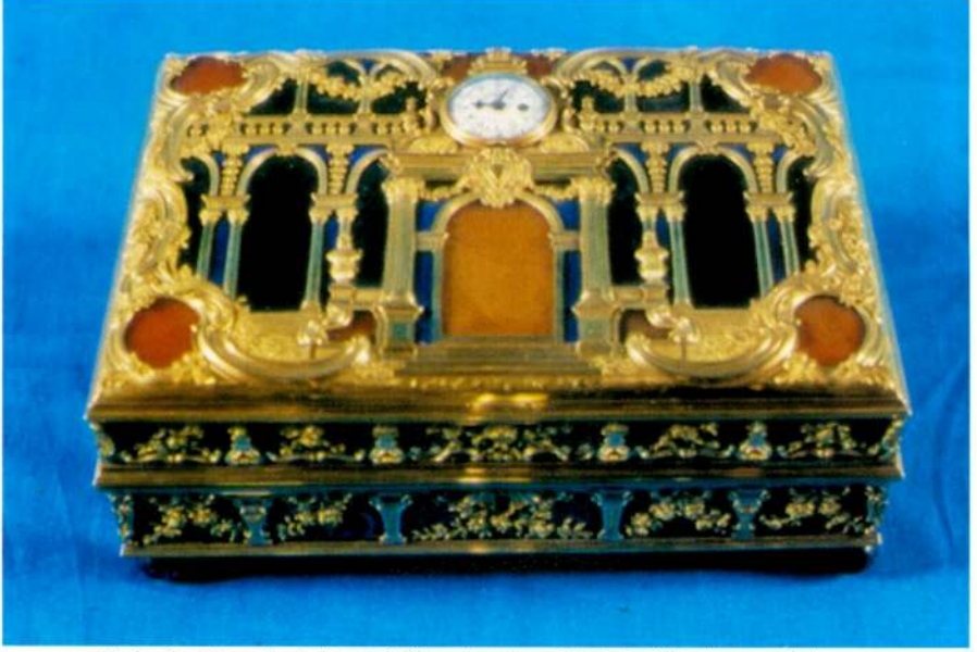
Resim 7 - Altın mine işli kutu üstüne oturtulmuş Markwick Markham markalı saat. (Topkapı Sarayı Müzesi.)