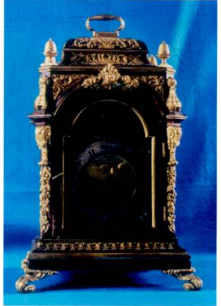
Resim 4 - Marwick Markham, London imzalı saat. (Topkapı Sarayı Müzesi.)