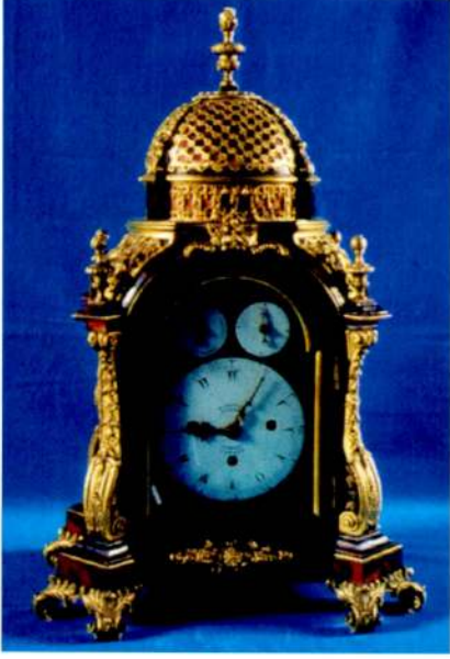
Resim 3 - Markwick Markham Perigal markalı, müzikli masa saati. (Topkapı Sarayı Müzesi.)