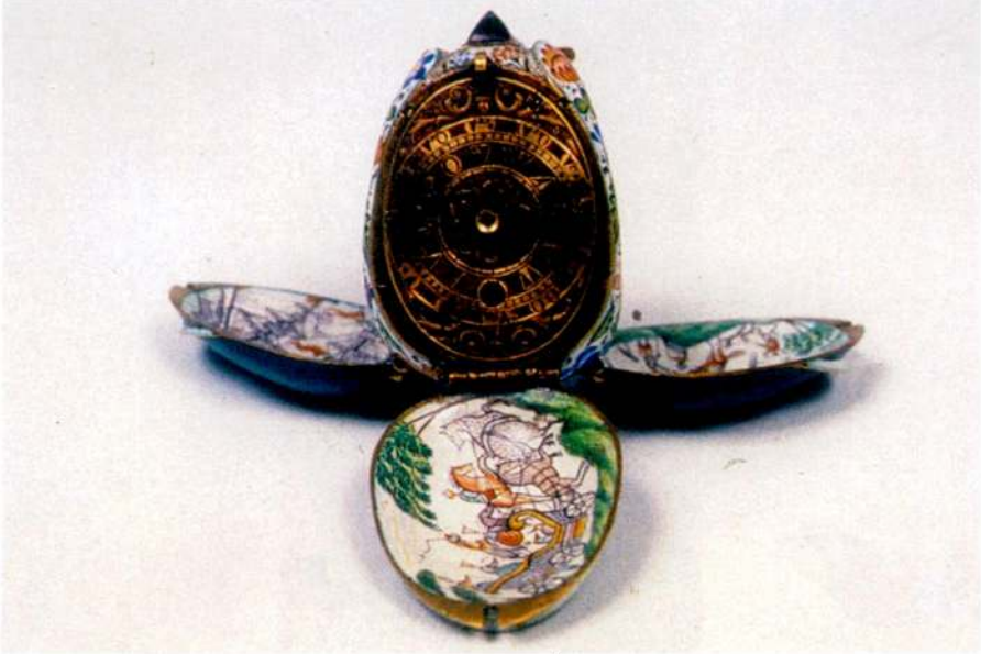
Resim 6 - Lale şeklinde Bird imzalı, ayet ve İbrahim, 1063 yazılı kolye saat. (Topkapı Sarayı Müzesi.)