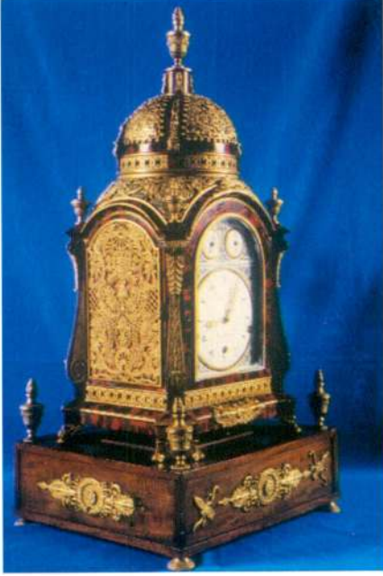
Resim 9 - Markwick Markham, London markalı masa saat. (Topkapı Sarayı Müzesi.)