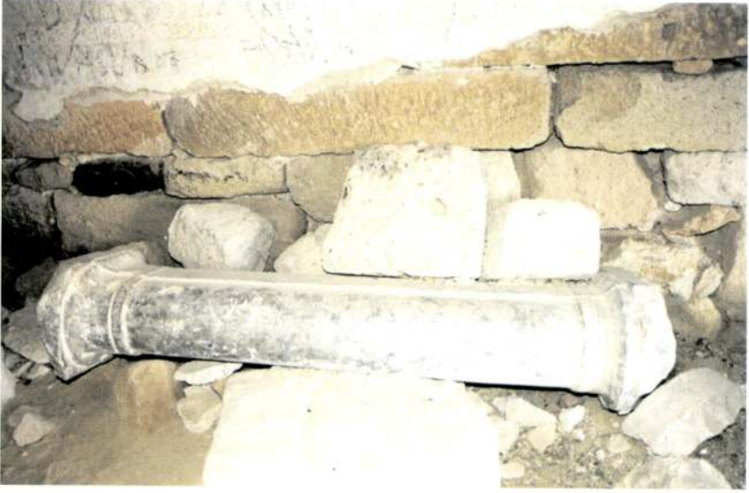
Resim 7 - Emre Sultan Türbesi'nin içindeki devşirme sütun - S.PARLAK