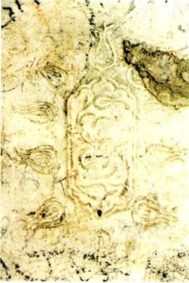
Resim 8 - Emre Sultan Türbesi'nin duvarlarındaki lalelerden detay - S.PARLAK