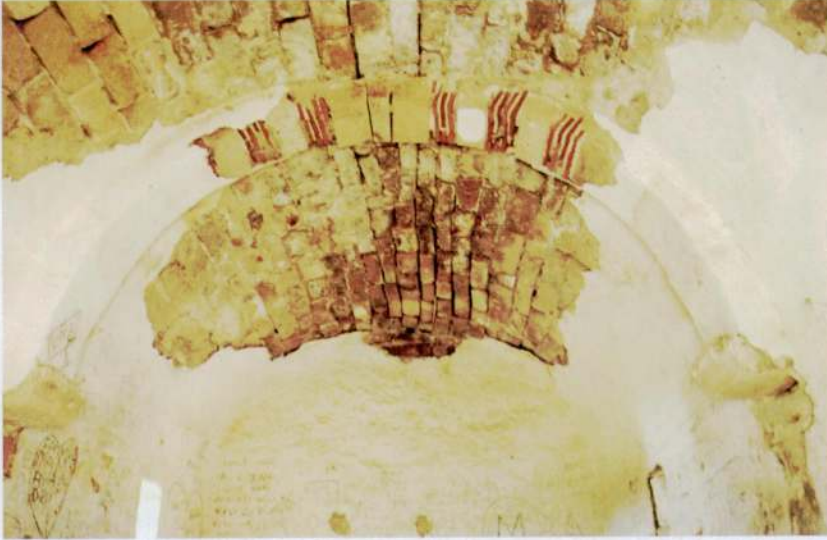
Resim 6 - Emre Sultan Türbesi'ni örten tonoz