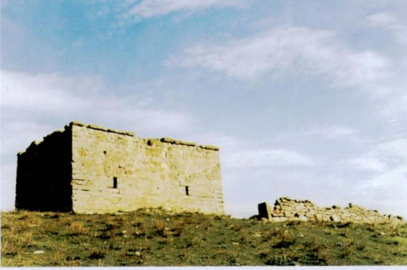
Resim 5 - Emre Sultan Türbesi'nin kuzey ve batı cepheleri