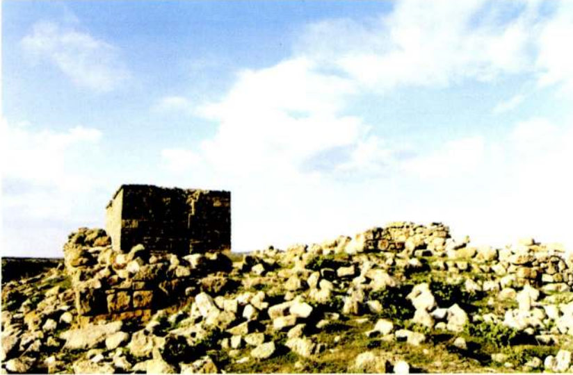
Resim 2 - Emre Sultan Zâviye ve Türbesi'nin genel görünüşü - S. PARLAK