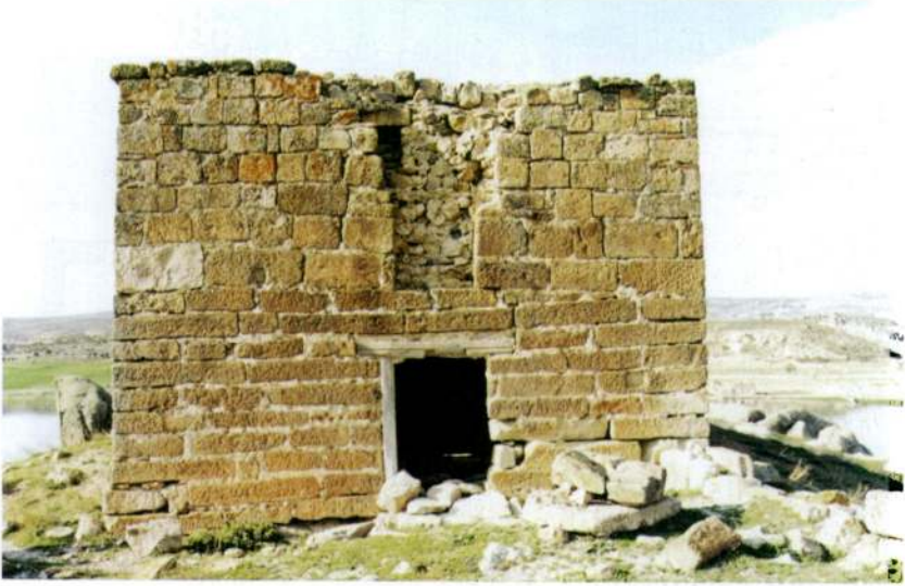
Resim 3 - Emre Sultan Türbesi'nin giriş cephesi - S. PARLAK