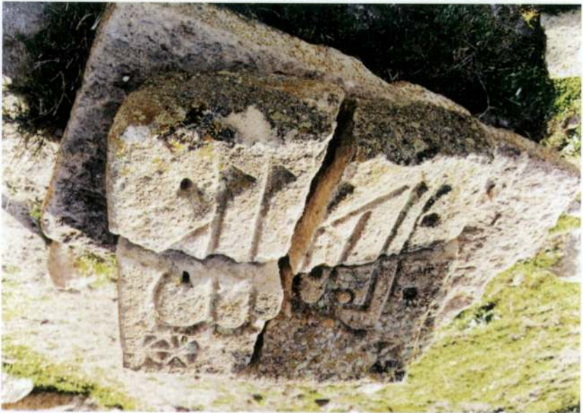
Resim 4 - Emre Sultan Türbesi'nin giriş cephesinden düşen yazılı taş - S. PARLAK