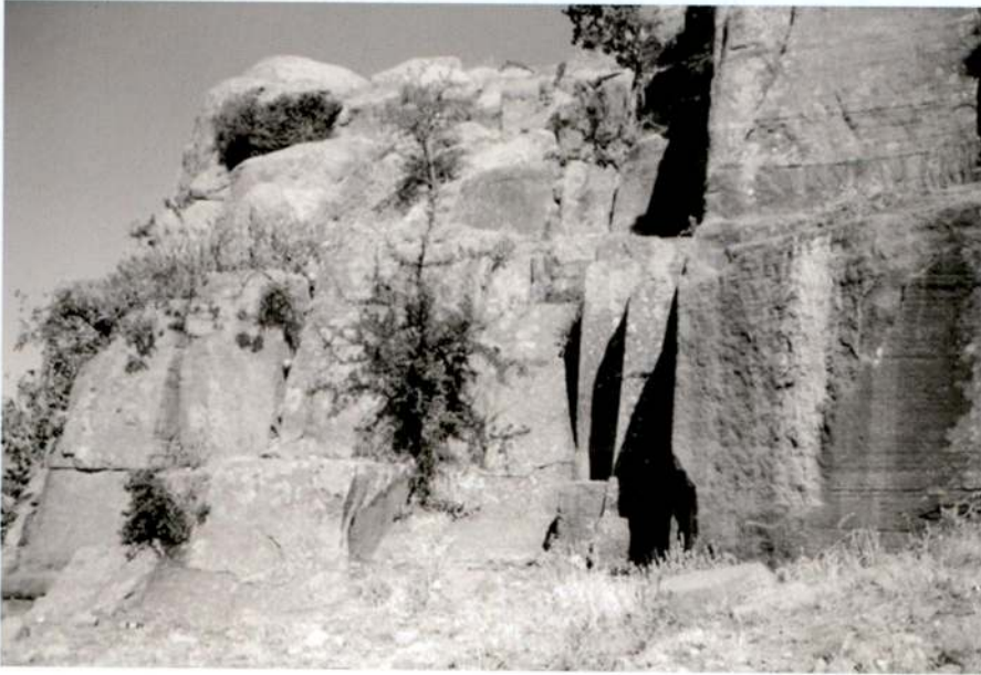
Resim 3 - Akropolisin eteğinde bir taş ocağı