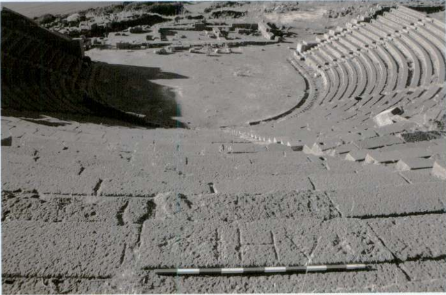
Resim 5 - Demirciler için rezerve edilmiş oturma sırası