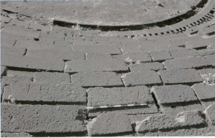
Resim 4 - Dericiler için rezerve edilmiş oturma sırası