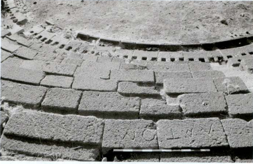
Resim 2 - Taş ocağı işçilerine için rezerve edilmiş oturma sırası