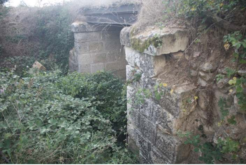
Resim 5: Uçmakedere Köprüsü