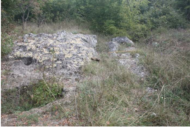
Resim 8: Vize-Akpınar Köyü Yollarla Yol İzi