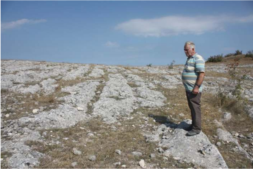
Resim 4: Erenler Köyü Yol İzleri