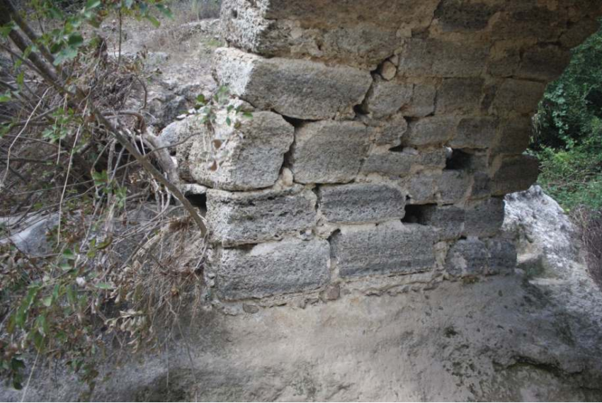
Resim 2: Kurtdere Köprüsü, Batı Ayağı