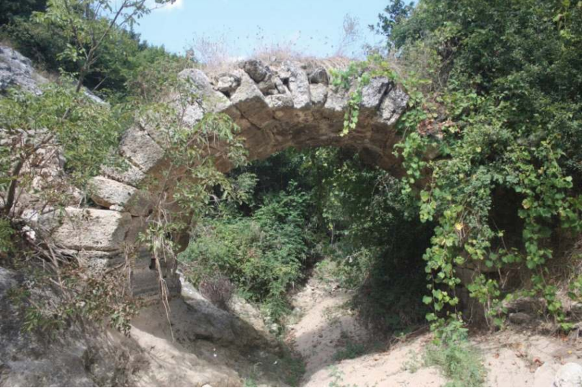
Resim 1: Kurtdere Köprüsü (Güneyden)