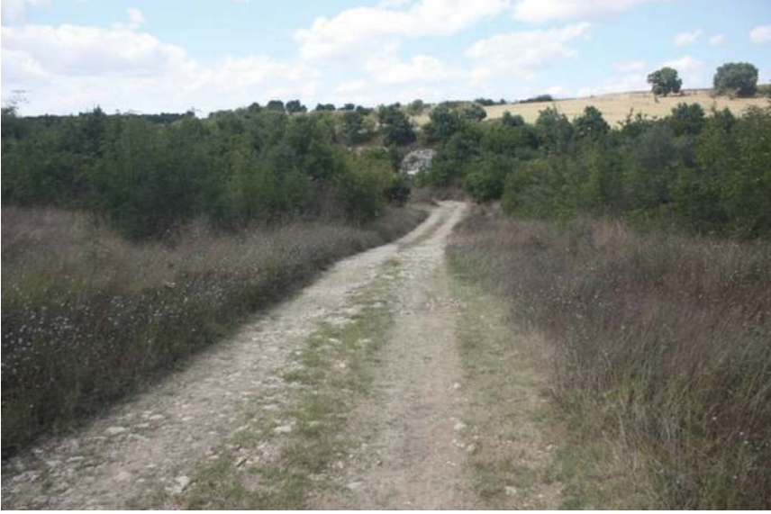
Resim 3: Kurtdere Köprüsü ve Yol Kalıntısı