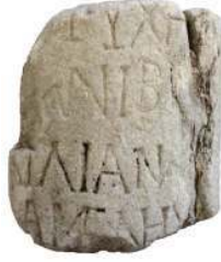
Resim 7: Hasbuğa Mil taşı Parçası