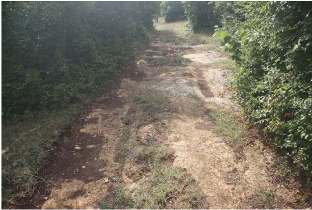
Resim 9: Vize-Akpınar Köyü Küpler Yol İzi