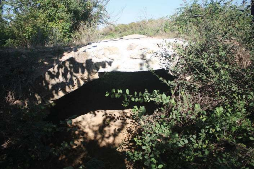
Resim 6: Eski Lefeci Köprüsü