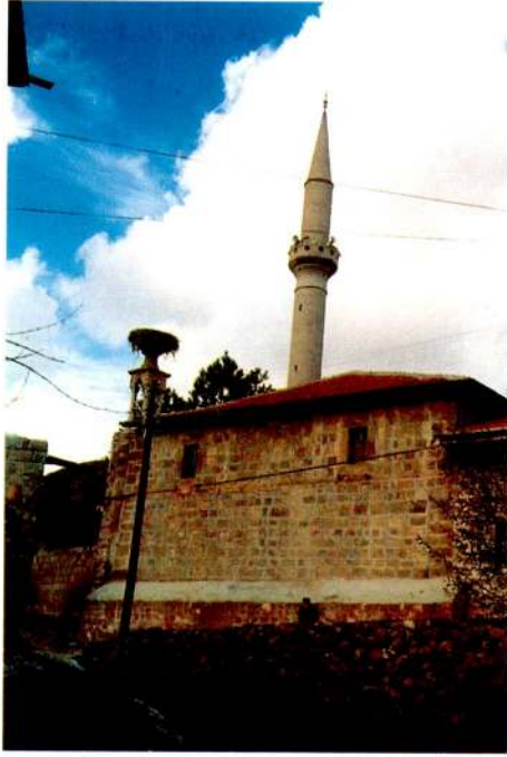
Res. 1 – Yazır Camii