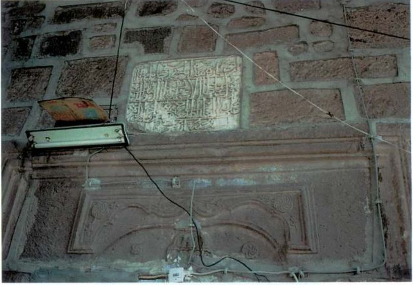
Res. 3 – Yazır Camii kapı üstü süslemeleri ve kitabesi