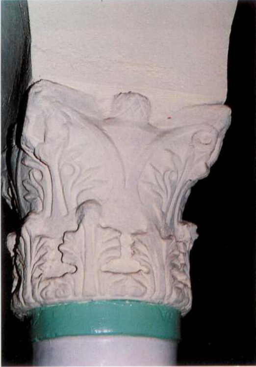
Res. 6 – Deşirme stn bařlıklarından birisi