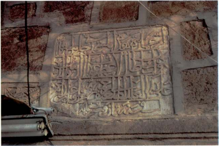
Res. 4 – Cami kitabesi