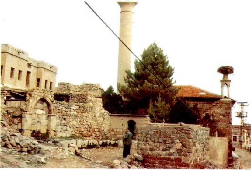
Res. 2 – Yazır Camii ve eşmesi