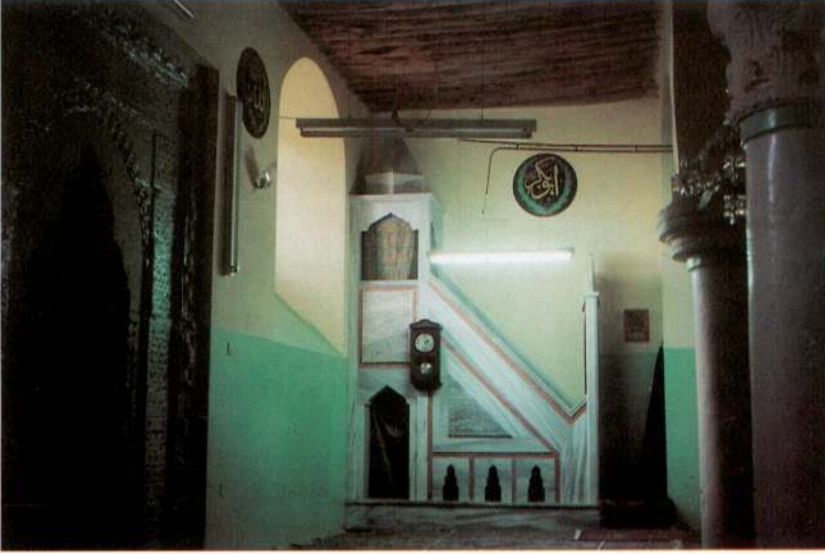
Res. 5 – Cami iinden grnş