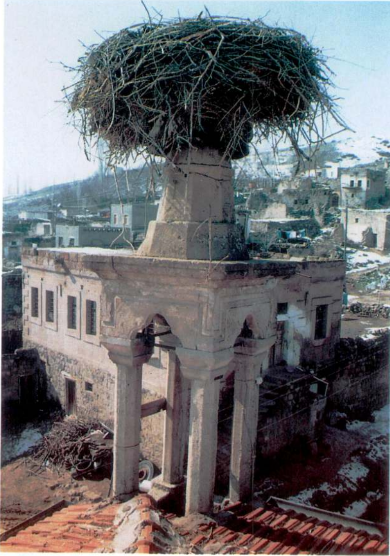
Res. 9 – Kşk Minare