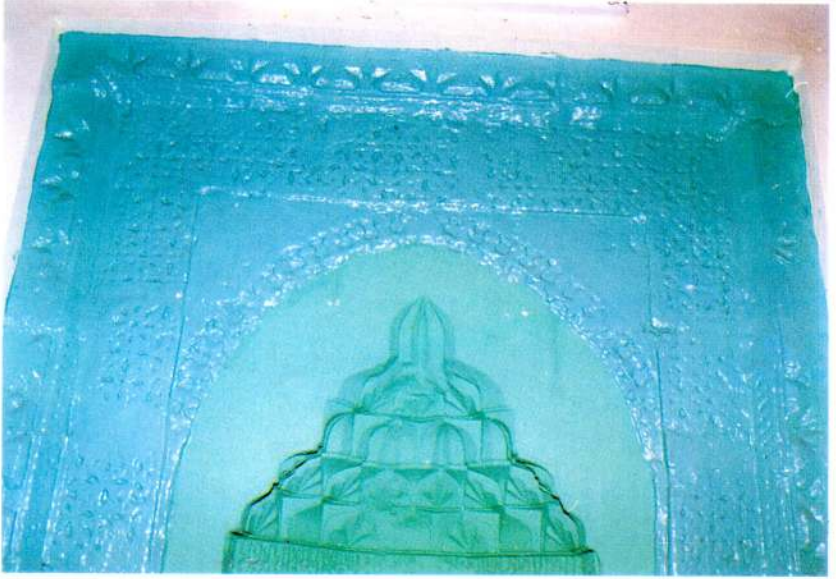
Res. 8 – Mihraptan detay