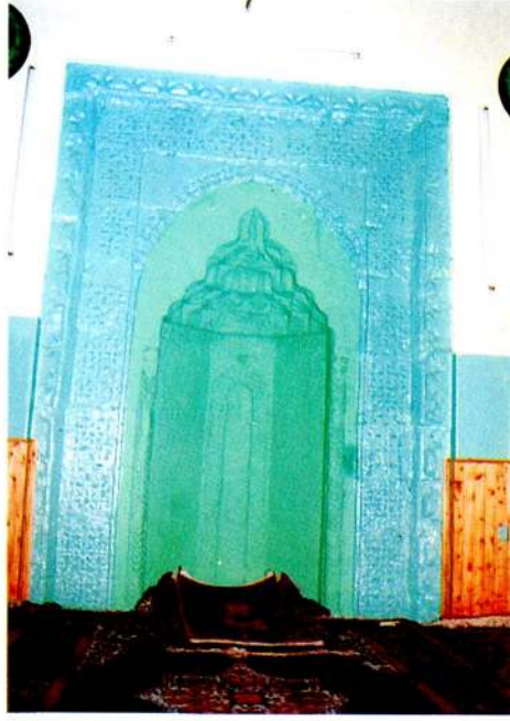
Res. 7 – Mihrap