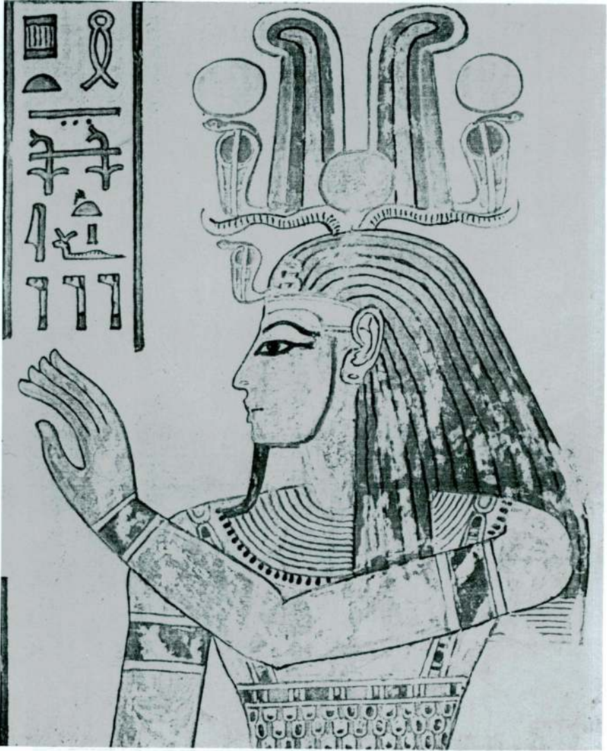
Res. 4 — Yeni İmparatorluk XIX. Hanedandan III. Ramses'in oğlu Amonhephef'in mezarındaki kraliyet tanrısı Ptah'ın alışılmışın dışında görüntüsü. Burada Ptah başının üzerindeki koç boynuzları, tanrı Amon'un iki deve kuşu tüyünden müteşekkil tacı, güneş diski ve kobra yılanları havi büyük bir tacla resmedilerek kraliyet tanrısı olarak gösterilmiştir. O halde tanrıların babası, yaratıcı tanrı olduğu vurgulanmıştır.