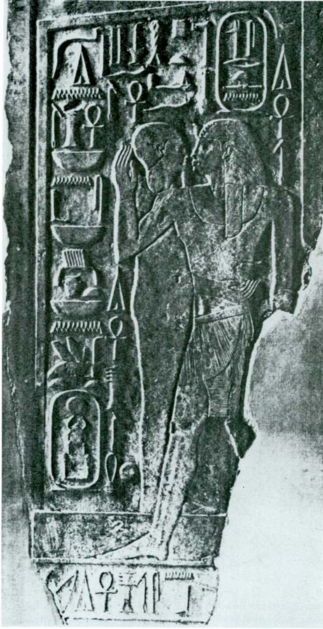
Res. 2 — Orta İmparatorluk devri XII. Hanedandan I. Sezostris (M.Ö. 1970 veya 1936-1928) kraliyetin koruyucusu tanrı Ptah'la birlikte.