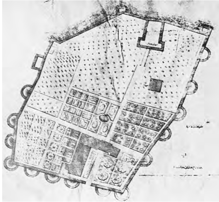
Harita 2. Bursa Sarayı Planı – E. H. AYVERDİ (1966)