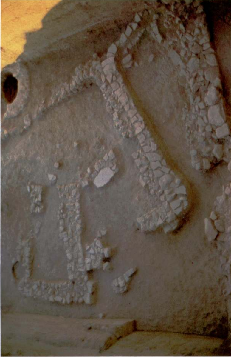
Kalkolitik (XXVI. kat) Evleri