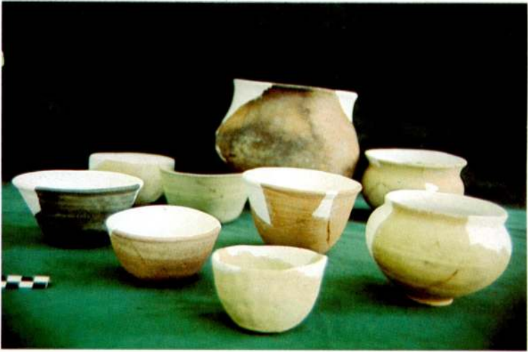
Eski Tunç Seramiği