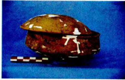
Kalkolitik (XXVI. kat) Çağ Mezarı