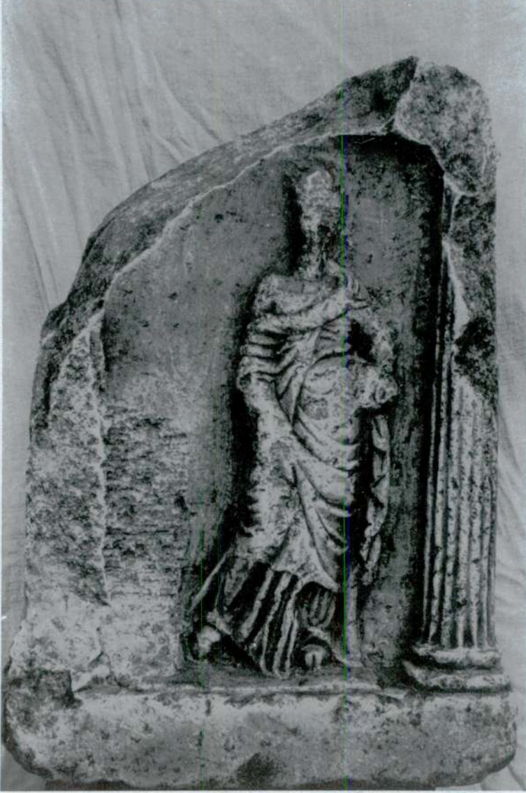
Res. 1 — Kızılk y Steli  n-y z