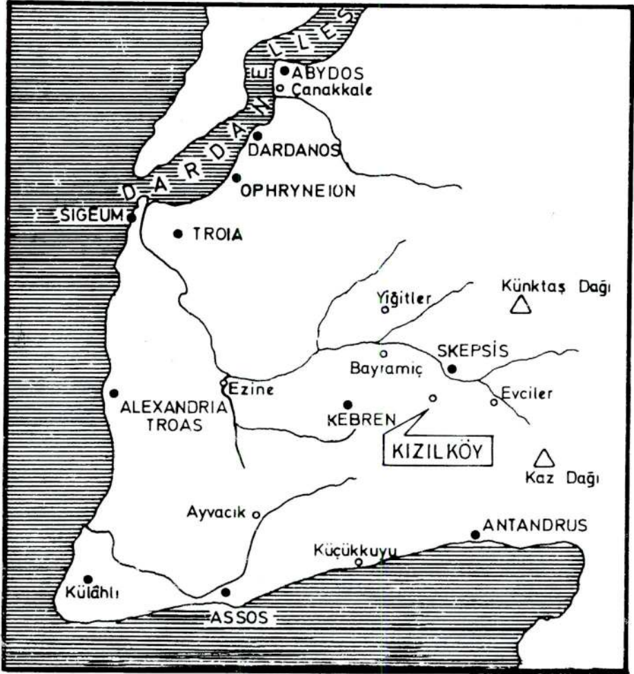
ÇİZİM I. KIZILKÖY ve yöresi