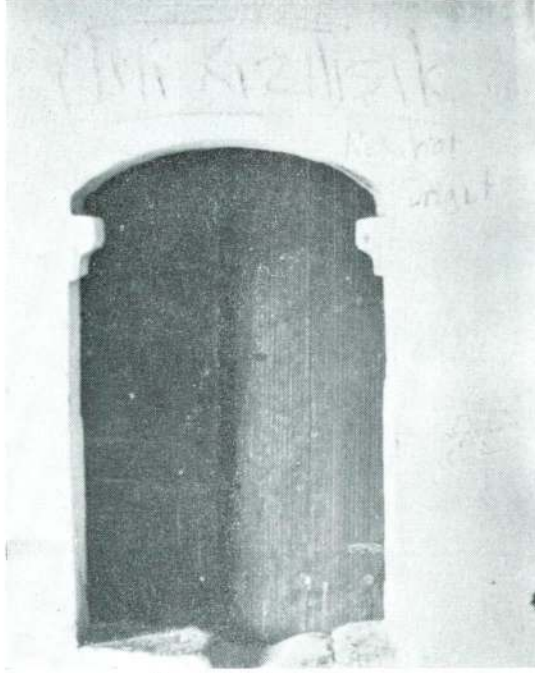
Res. 3 — Mescid kapısı