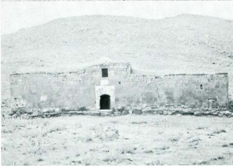
Res. 1 — Dođu cephesi