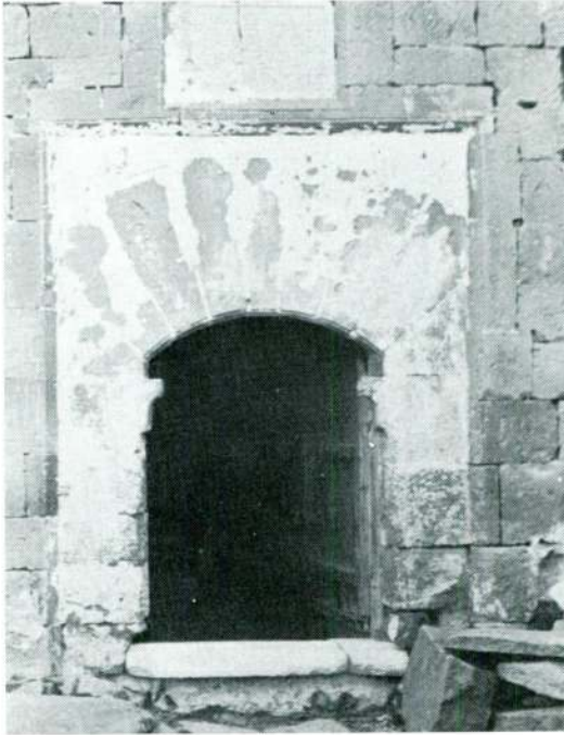
Res. 2 — Cümle kapısı