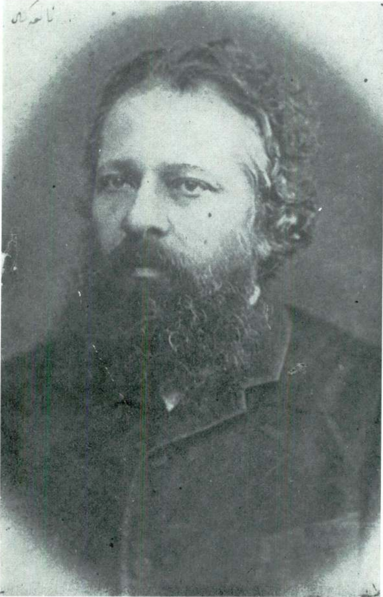
O yıllarda Namık Kemal