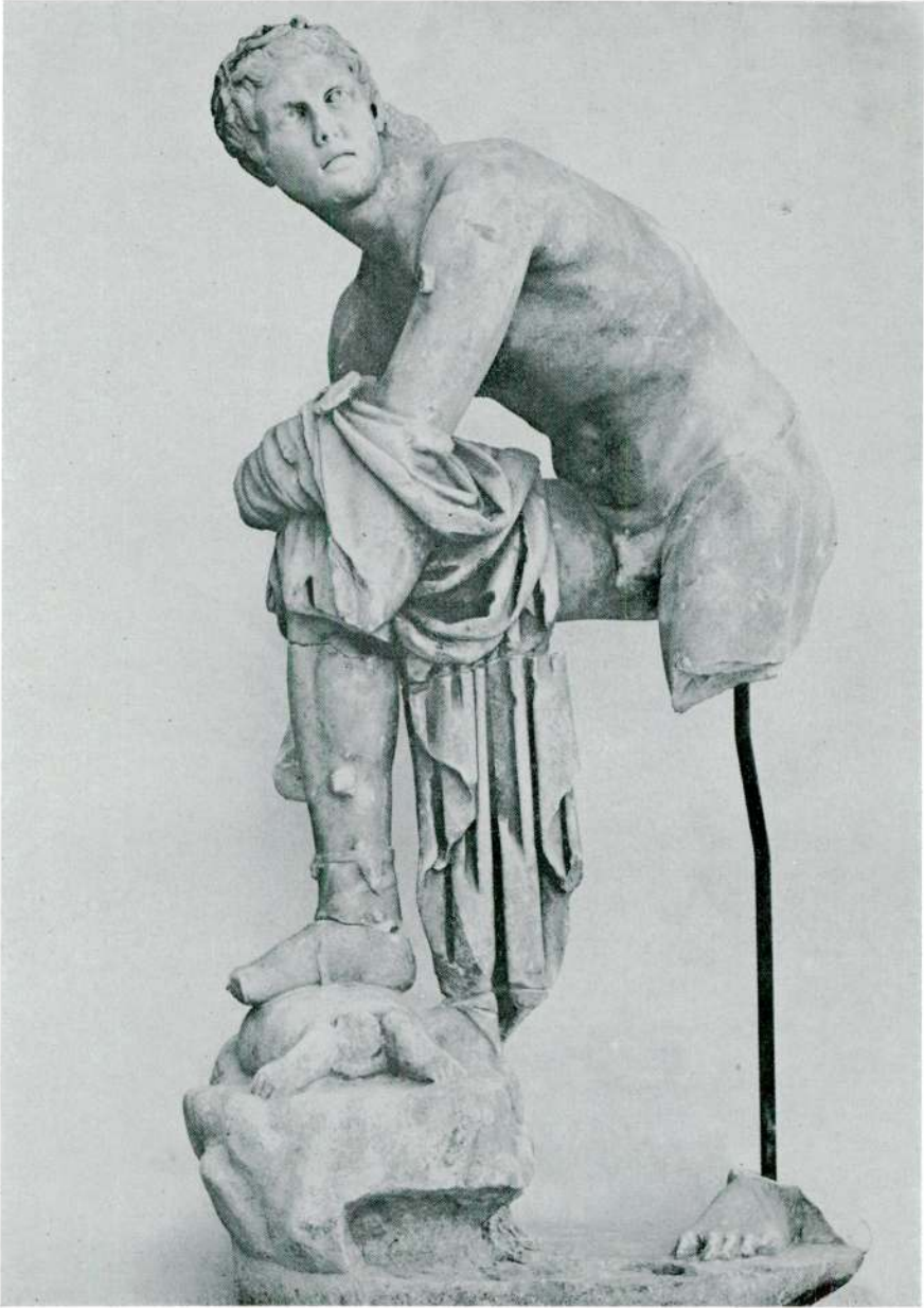
Lysippos'un sandal bağlayan Hermes heykeli