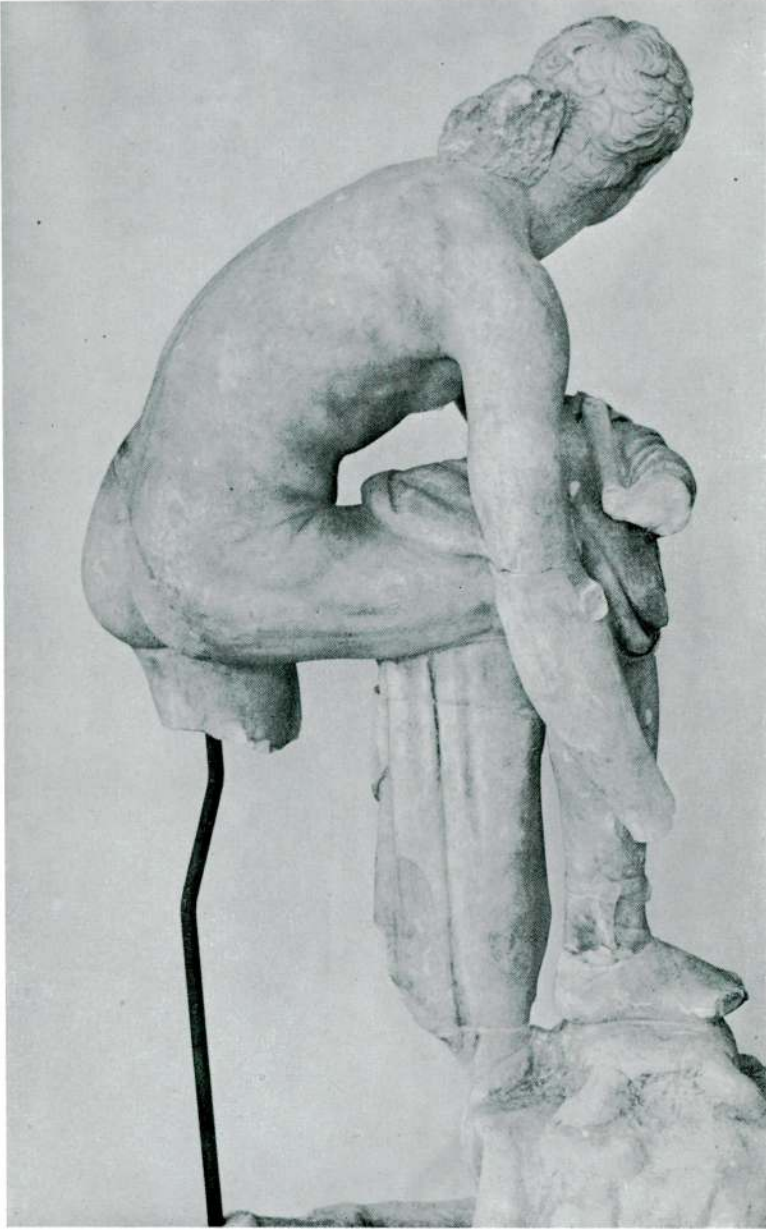
Lysippos'un sandal baęlayan Hermes heykeli