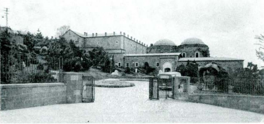
Anadolu Medeniyetleri müzesi, sağda Bedesten, solda Han görülmektedir.