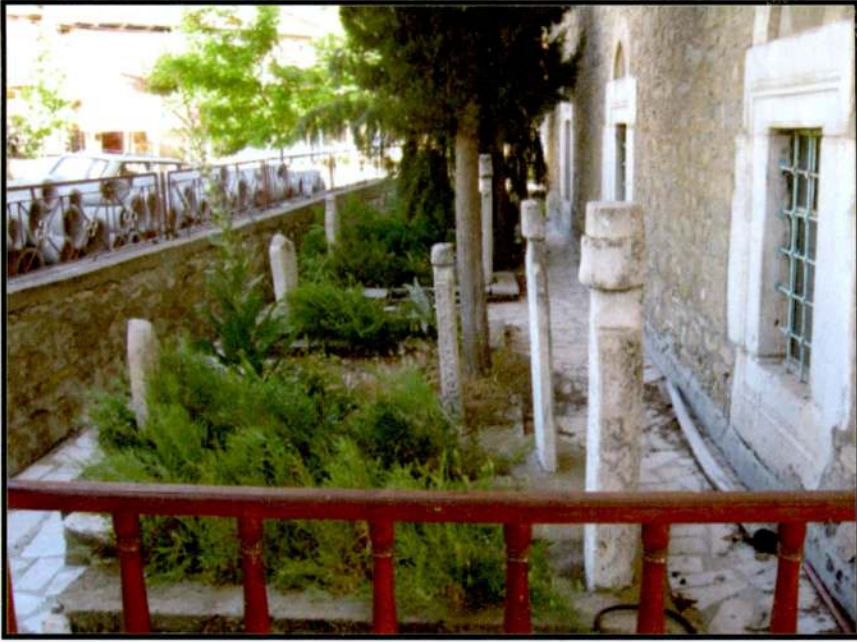
Resim 5 Hırka Camii Haziresinin Yandan Görünüşü