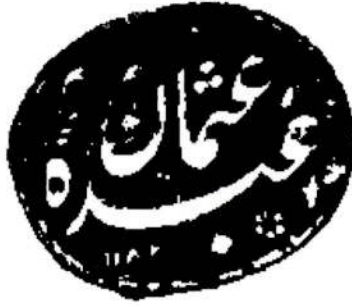
Resim 1 Osman Ağa'nın mührü