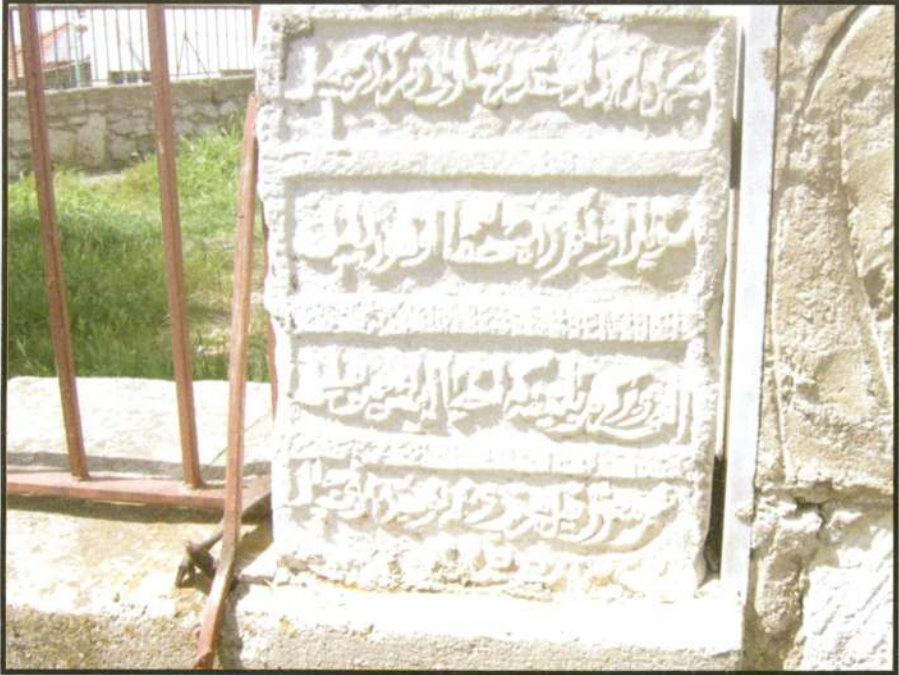
Resim 2 Hırka Camii Dış Kapı Kitabesi