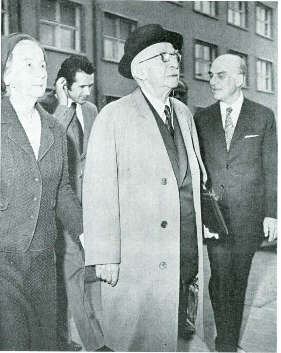
Sayın İnönü seminere gelirken sayın eşi ile birlikte