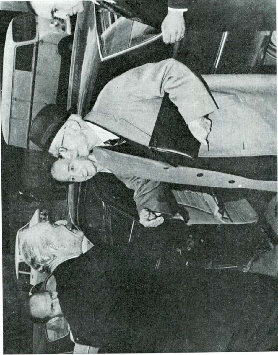
Sayın İnönü, Türk Tarih Kurumunca düzenlenen "Cumhuriyetin 50. yıldönümü" seminerinde konuşmasını yapmak üzere 23 Ekim 1973 günü Kuruma gelirken