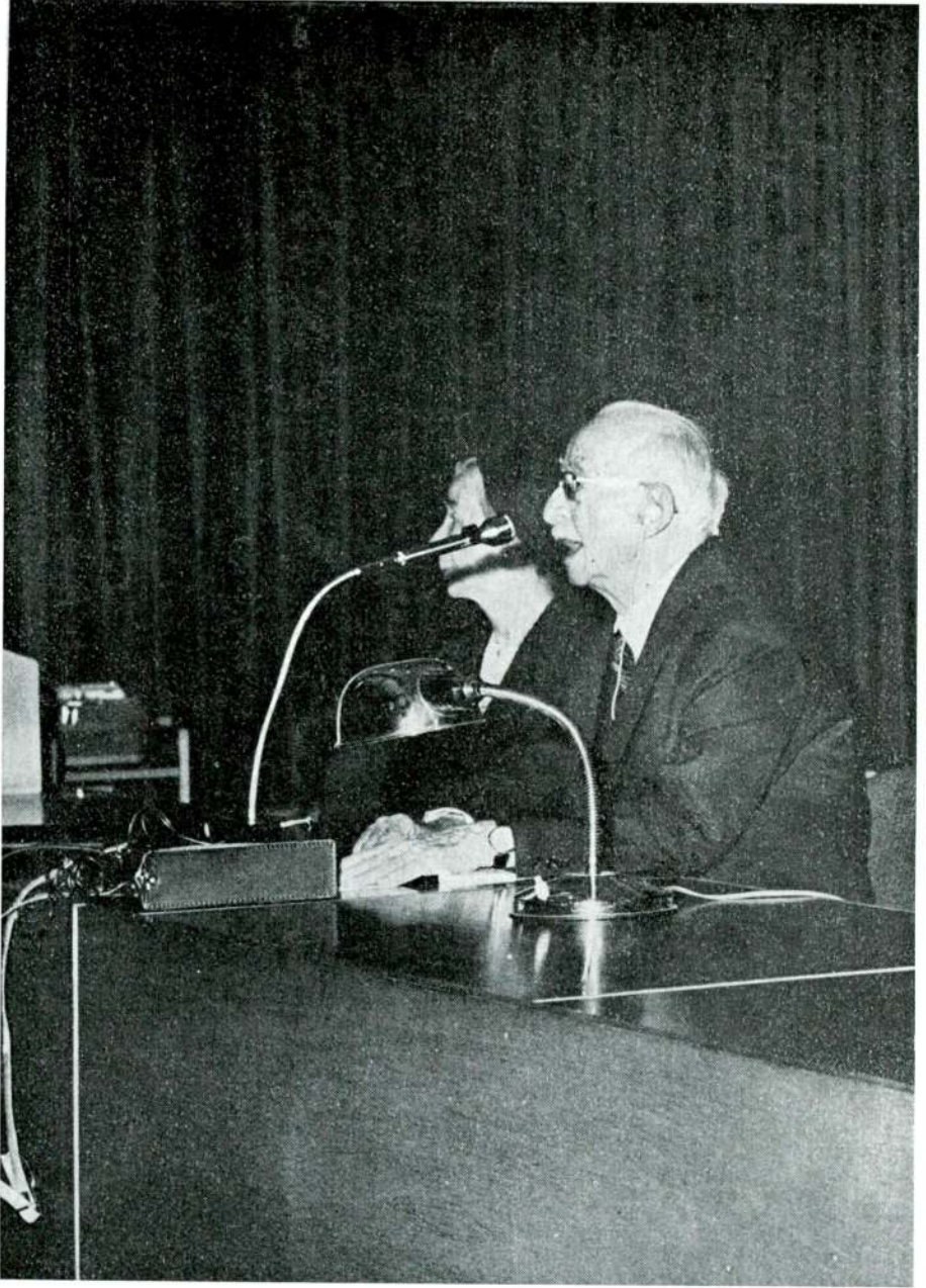
Sayın İnönü seminerde konuşmasını yaparken (yanında sayın eşi)