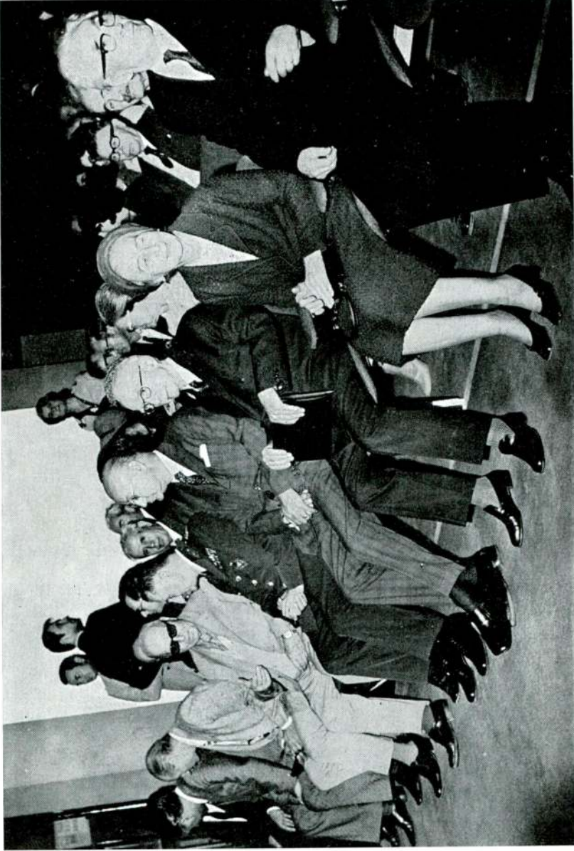
Sayın İnönü ve eşi seminare katılanlar arasında